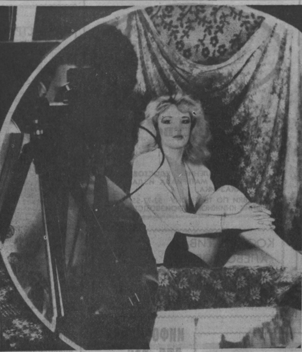
фотоконкурс «Мир и мы» ОРИГИНАЛ.