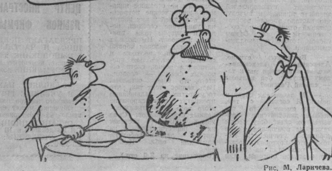
Рис. М. Ларичева.