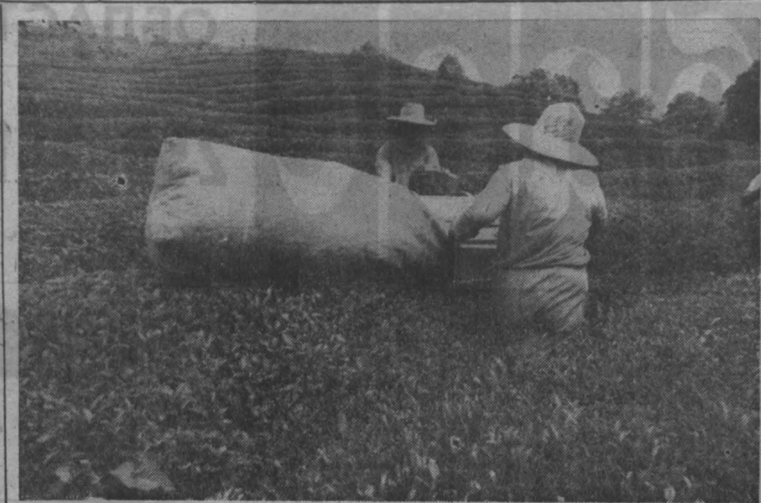
к вашему столу