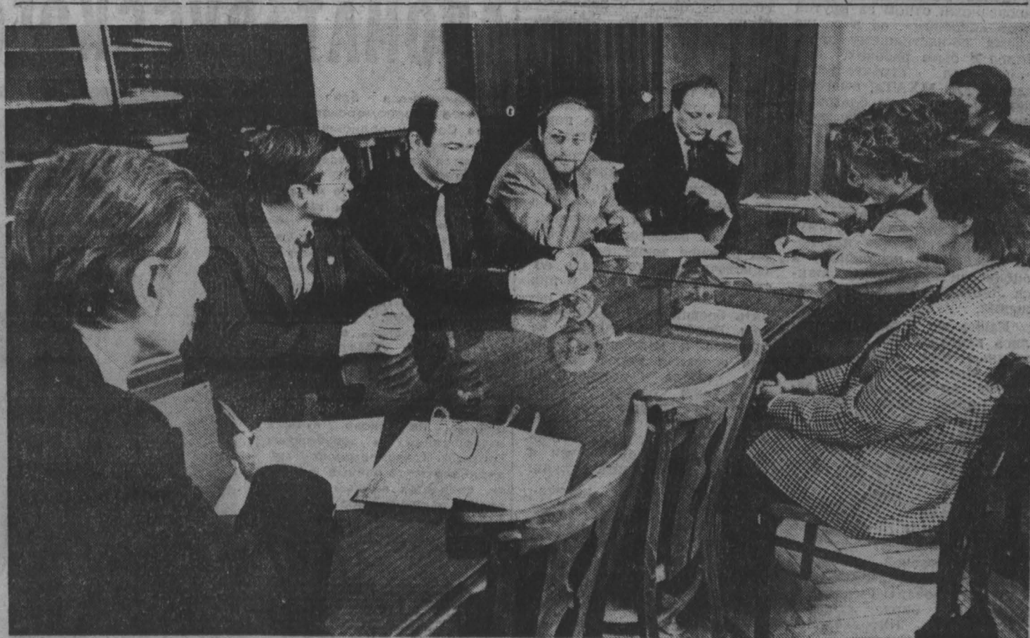
борьба с преступностью