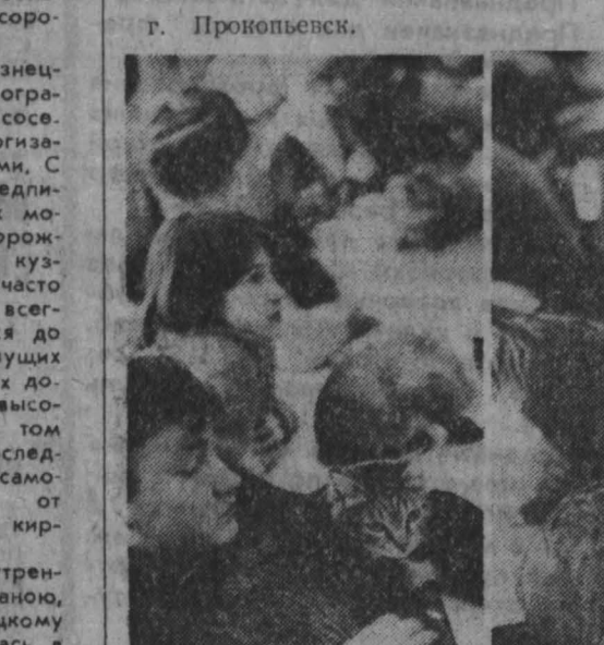
НА СНИМКАХ: кот Беат на выставке.

В Прокопьевске прошла выставка новокузнецкого клуба любителей кошек «Шо-нуар», что значит в переводе с французского «Черный кот». В феврале клубу будет два года. Сюда постепенно вошли клубы других городов Кузбасса, ставшие его филиалами. В области он единственный. Здесь выращены различные породы кошек: сиамская, ориентальная, бенгальская, персидская, европейская, турецкая ангора, сибирская. Проктопьевские любители познакомились с восьмью кошками Новокузнецка. Около 60 юных питомцев представлены проколемиями. На выставке работал эксперт с помощником-стюартом. Отбор кошек велся профессионально. Новокузнецкий эксперт постоянно ездит на международные, всесоюзные, зональные, городские выставки. Недавно питомцы «Шо-нуара» посетили Красноярск, где заняли призовое место и получили оценку «отлично». Триглер привлек персидский кот Беат, он поедет на международную выставку в Санкт-Петербург. Н. БАБАРИЦКИЙ.