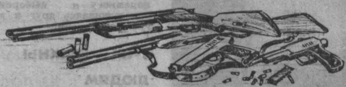
Рис. В. Илиндева.

Большинство людей высказываются за продажу и ношение оружия для защиты от посягательства преступников. Но действительной ли окажется такая защита? Об этом размышляет автор материала «ОПАСНАЯ ЗАЩИТА».