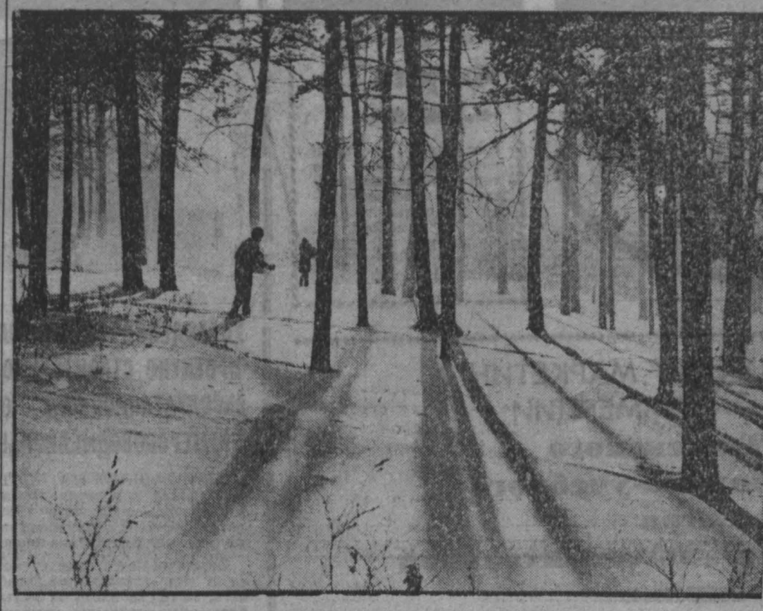
Утро в бору.