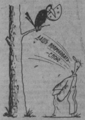
Рис. М. Ларичева.