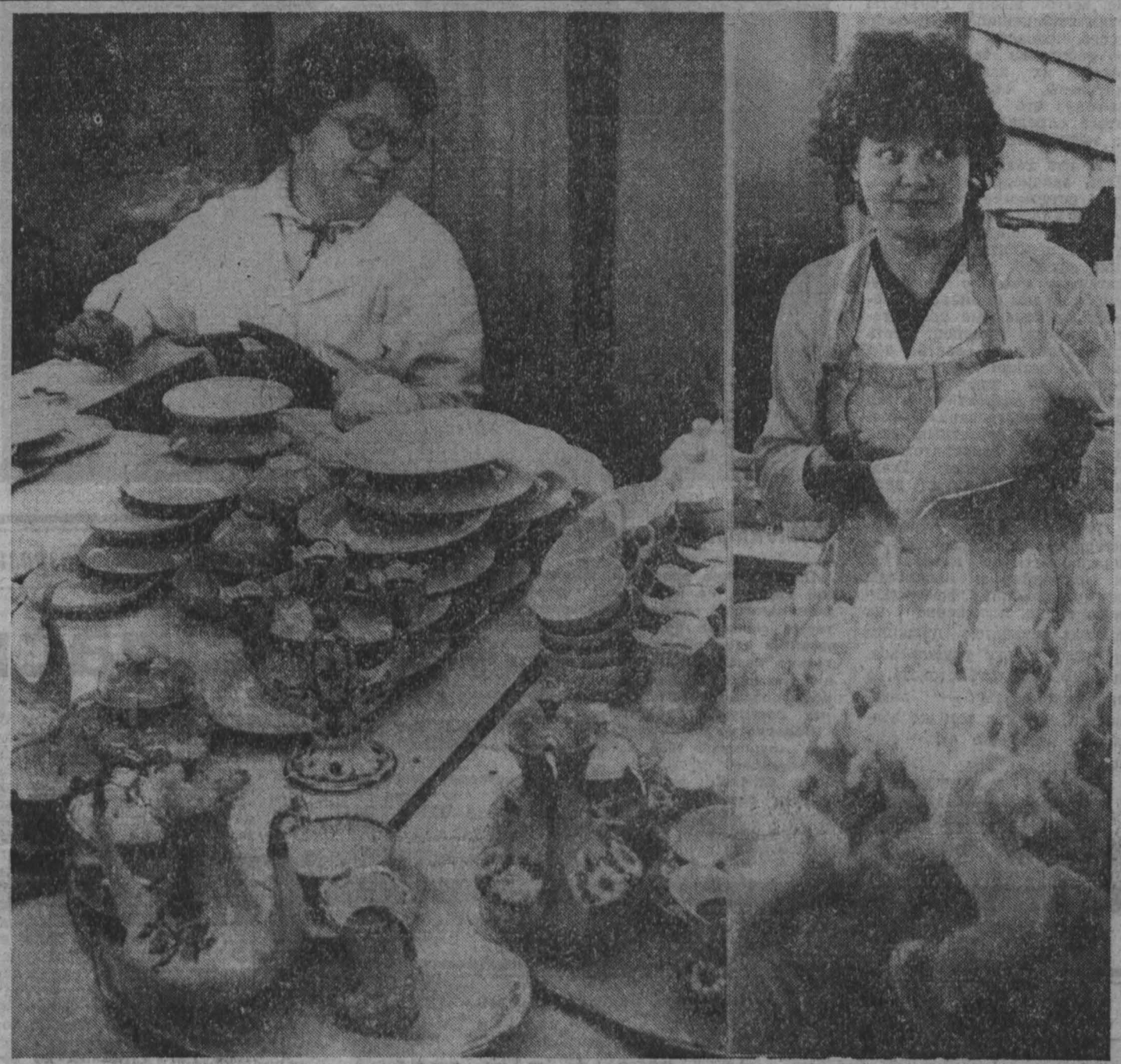
Красивая, нужная продукция выходит из цехов Прокляевского фарфорового завода. И изготавливают ее столь же прекрасные женщины. Через их руки проходят превосходные столовые и чайные сервизы, сувенирные изделия.

В. КАРМАНОВ, корр. «Кузбасса», Чебулинский район.