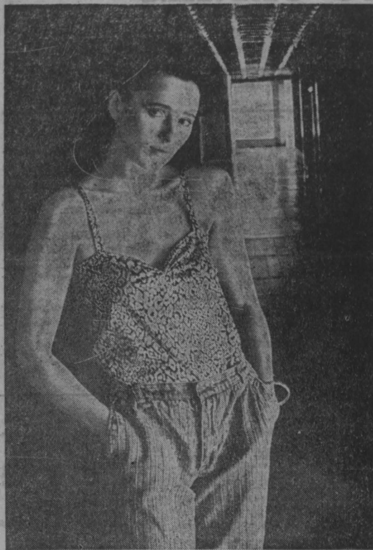
фотоконкурс «Мир и мы»