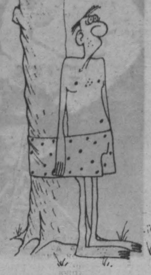
Рис. И. Азмова.

В остальном же — с уважением. Надеюсь, и статья Милютинки, и мой ответ на нее, как они, может быть, обе ни несовершенны, все-таки нужны.