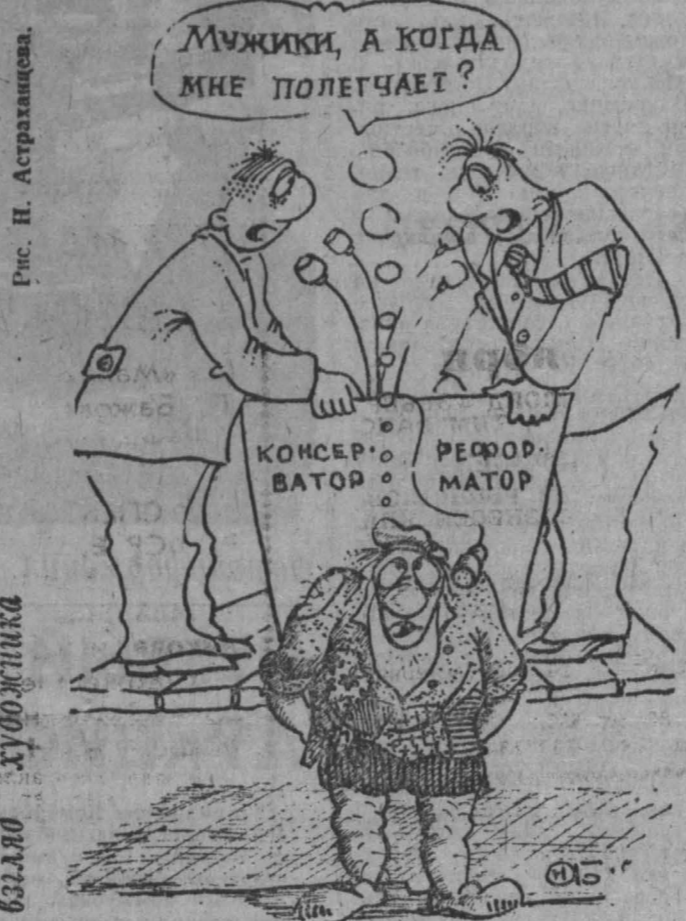
Рис. Н. Аспрановская. Художник В. Бугаев.

имущий позволял себе пренебречь господствующим настроением людей, не увидев главного, не заметив свою собственную основу. И хотя этот путь может быть достаточно долгим, конец его предопределен. А в сегодняшних условиях и долги ему стать не удастся. Как не удастся задурить голову избирателям откровенно иерархическими, крайне неважисательными рассуждениями о «личных политических амбициях», «неприкрытом стремлении к авторитарной власти» человека, имя которого у определенной части «демократов» упоминается только в ругательном смысле. Ну хорошо, А. Тулеев популист, ничего не понимающий в экономике, но он же берет за образец свою популистскую программу. Так дате ему такую возможность? Хотя бы для того, чтобы завладеть самим собой и развезти вокруг собственной персоны дым популизма. Нет, говорят «демократы»-профессоры, мы сами ничего не можем сделать, и Тулееву делать ничего не дедим.