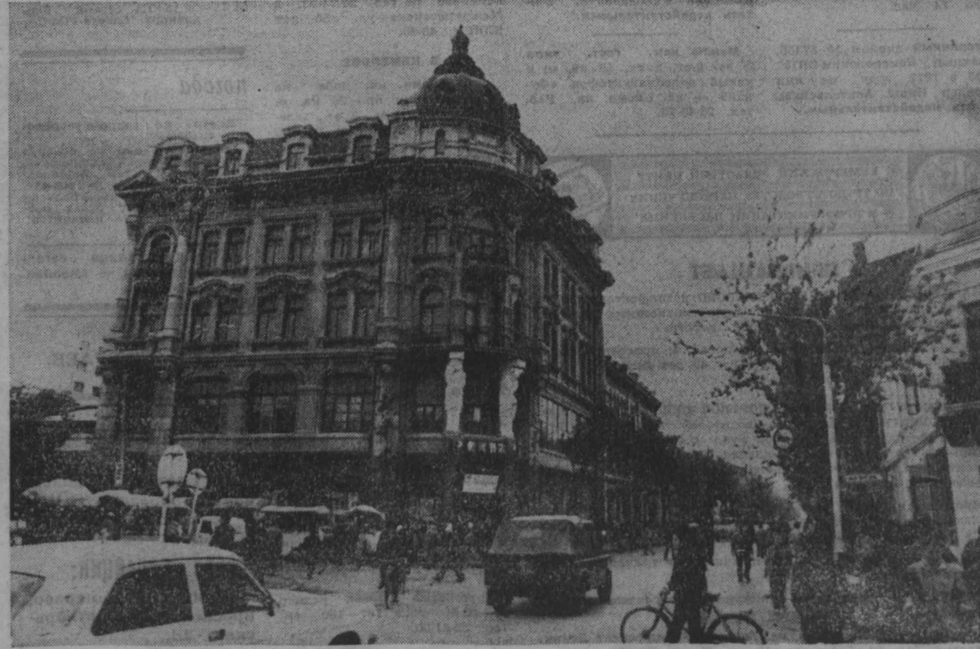
новости, события, факты