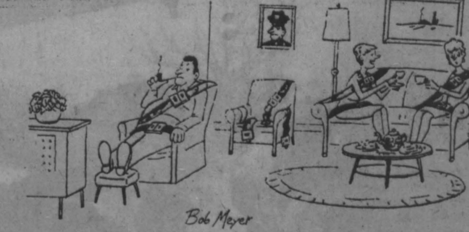
Гарольд служит в автоспекции и отвечает за неукомплектованное применение ремней безопасности... (Рис. из «Наши инквизиторы»).

Претория—Хараре. КУЗБАСС 30 января 1991 3