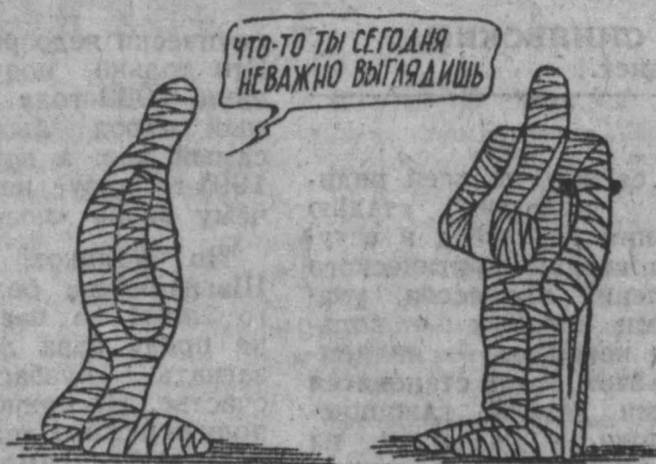
Рис. М. Ларичева.

«Как «Пульс» разошелся с «Нашей газетой»