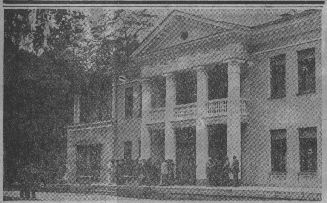
Этот дом с белыми колоннами расположен в дачном поселке Ново-Огарево в Подмоскovie. Здесь шла работа над договором по формуле «9 плюс 1», который из-за августовских событий так и не был реализован.