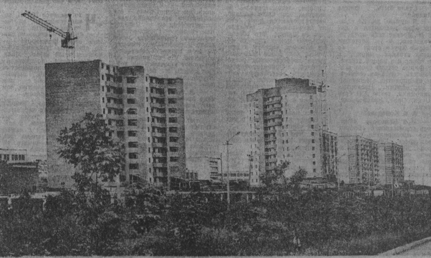
Растет микрорайон Прокопьевска.