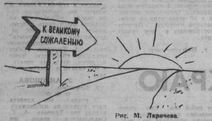
Рис. М. Ларичева.