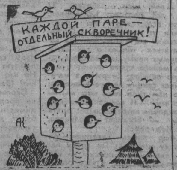
Рис. А. Климова.