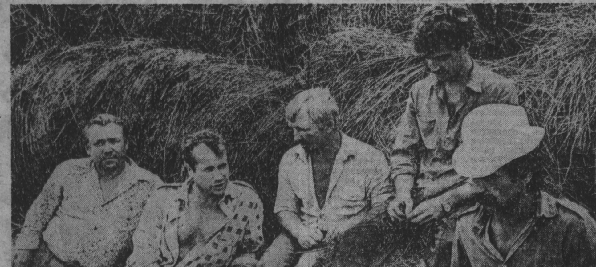
КУЗБАСС 7 августа 1991

Социальная отсталость Кузбасса — основа социального кризиса. Корни забастовок — тут.