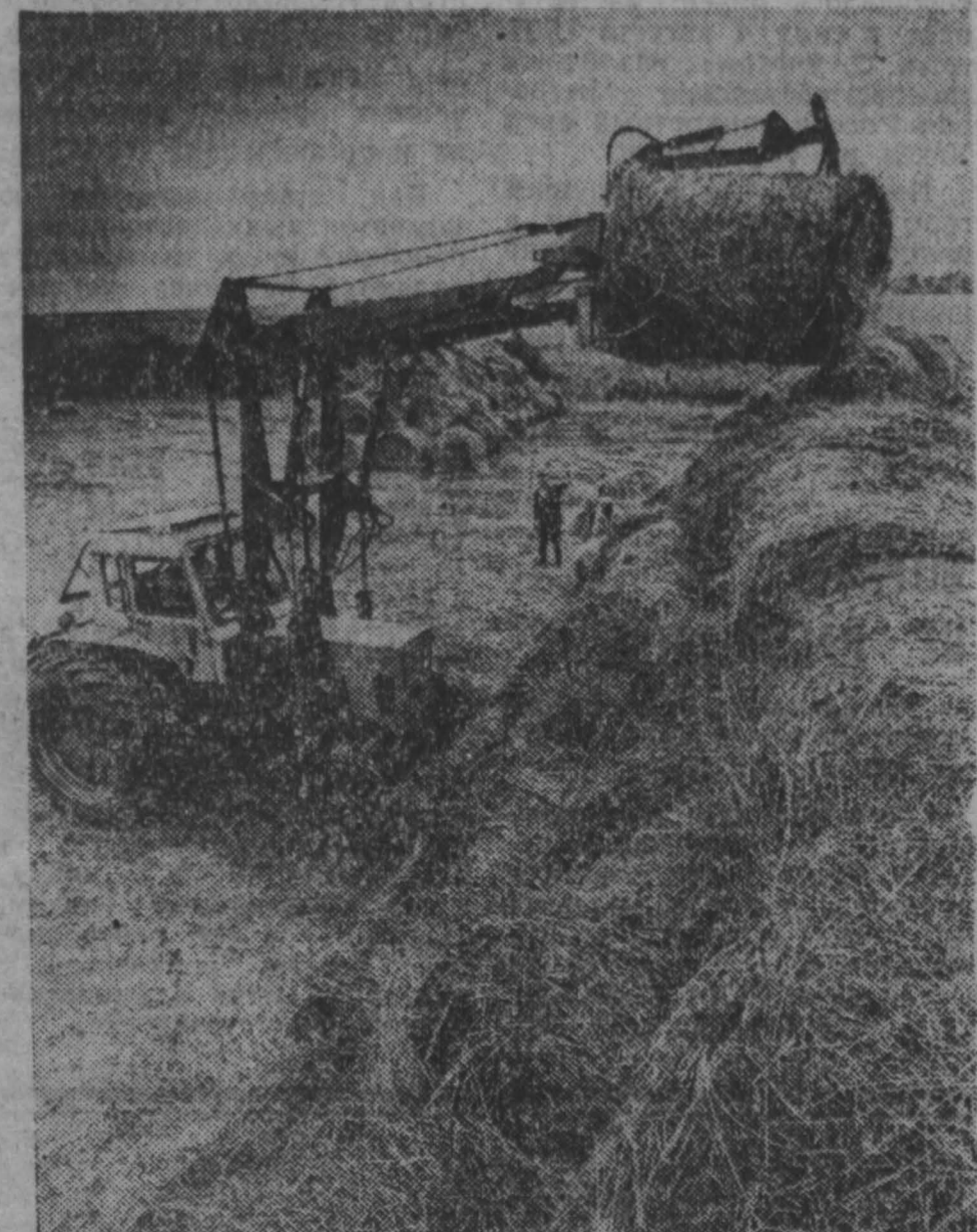
КУЗБАСС 7 августа 1991