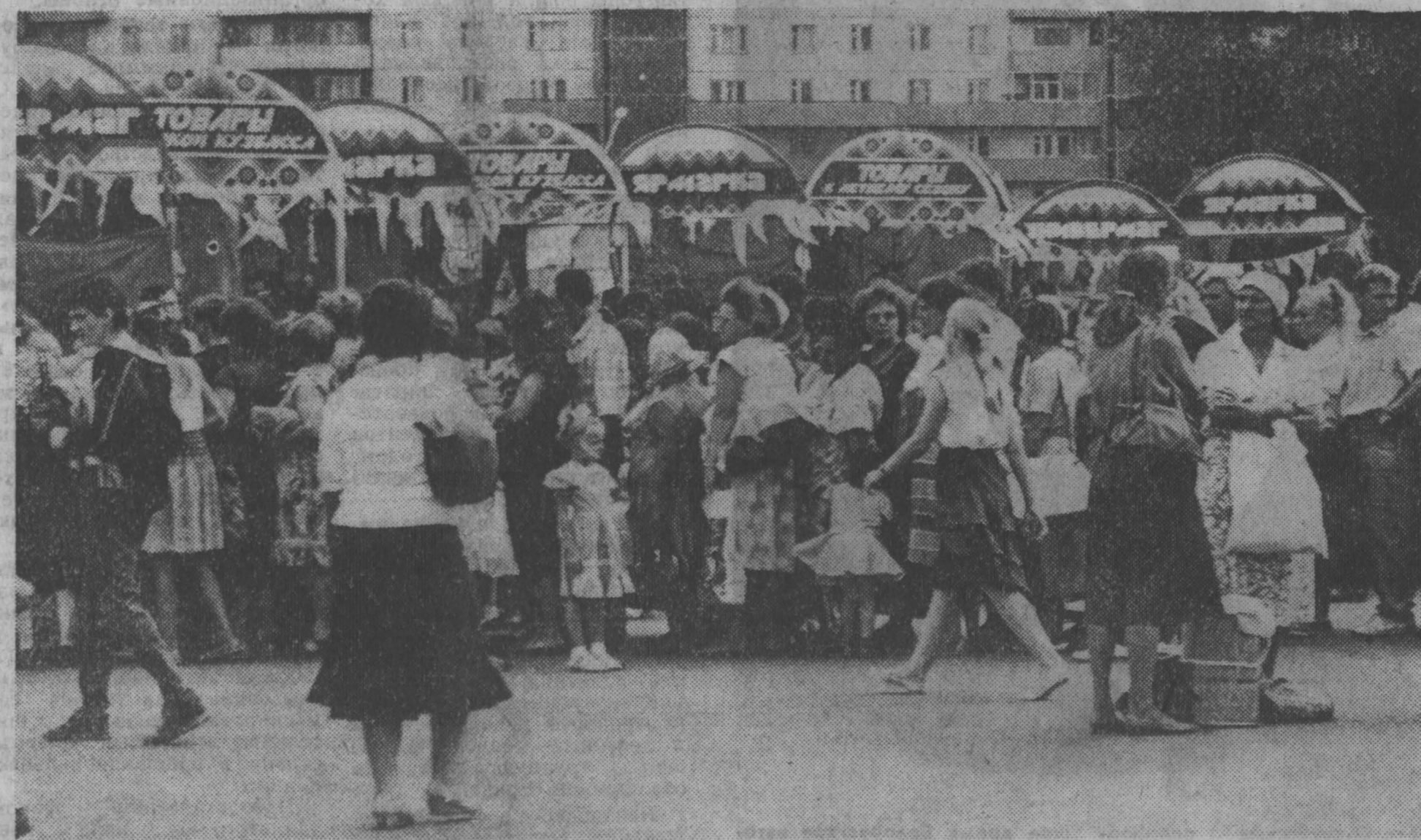
Ярмарка — всегда праздник в наше время тотального дефицита. Не стала исключением и эта, прошедшая на днях в областном центре.

Партия и страна вступили в 30-е годы в состояние кризиса и разрыва, появились межклассовые конфликты, идет динамичный распад исторически сложившихся экономических, политических, духовных связей, составляющих основу Союза. В 1990 году произведенный национальный доход снизился по сравнению с 1989 годом на четыре процента. Производительность труда упала на три процента. Целевая эмиссия составила 24 миллиарда рублей. Рост незавершенного (Окончание на 2-й стр.)