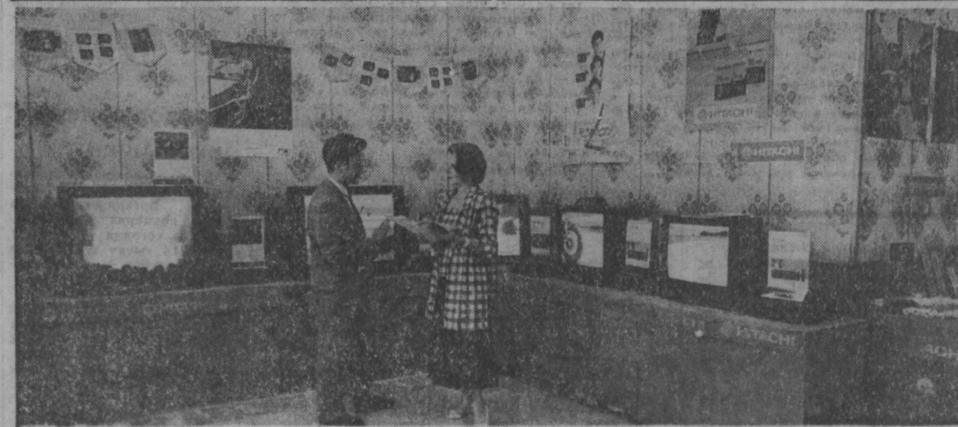
В Кемерово проходит выставка японской фирмы «Сумитомо корпорация». Представлены новейшая электронная бытовая техника, большеклассная холодильная установка, медицинское оборудование.

Москва, Дом Советов РСФСР, 24 июня 1991 года.