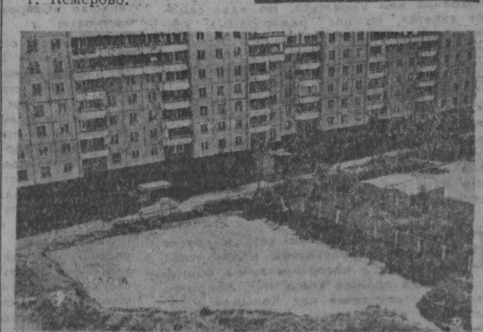
Фото Ю. Сергеева, г. Кемерово.

НА СНИМКАХ: рукотворное озеро; бегут зловонные стоки по асфальту.