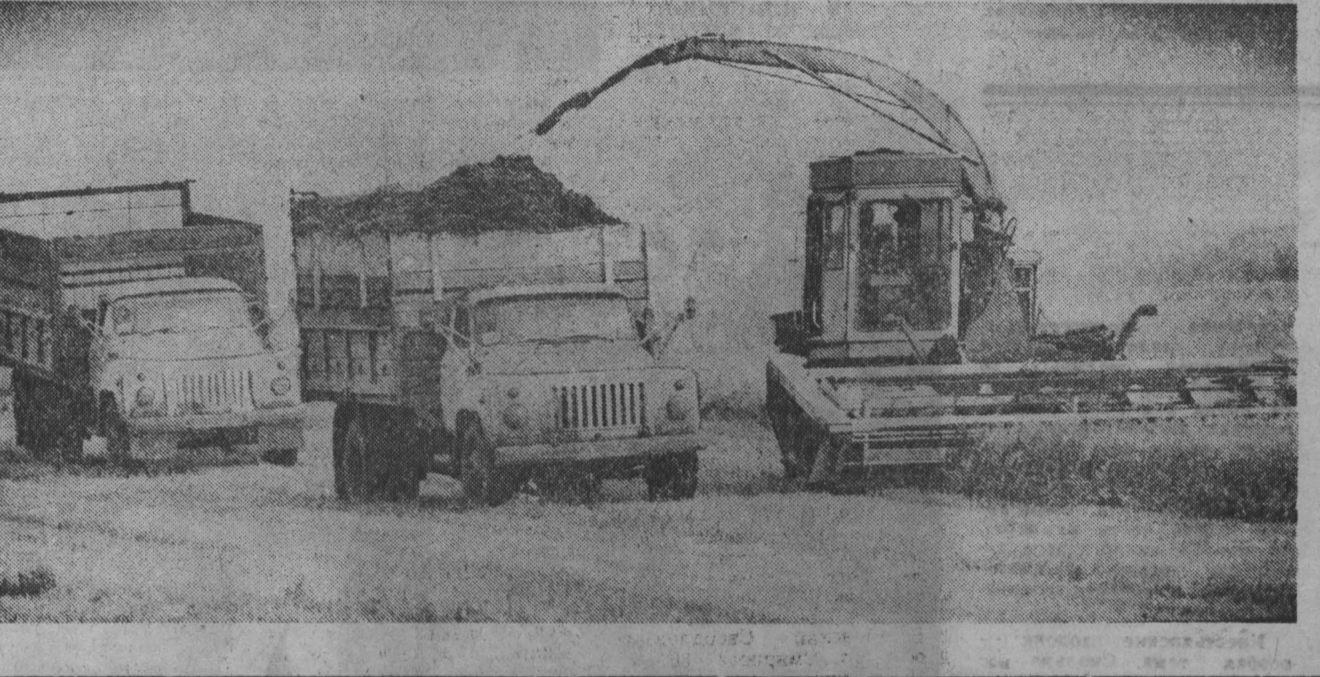
наши корреспонденты сообщают