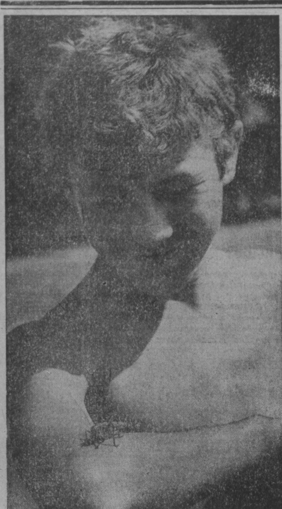
фотоконкурс «Мир и мы» «Нежданный гость» г. Кемерово.