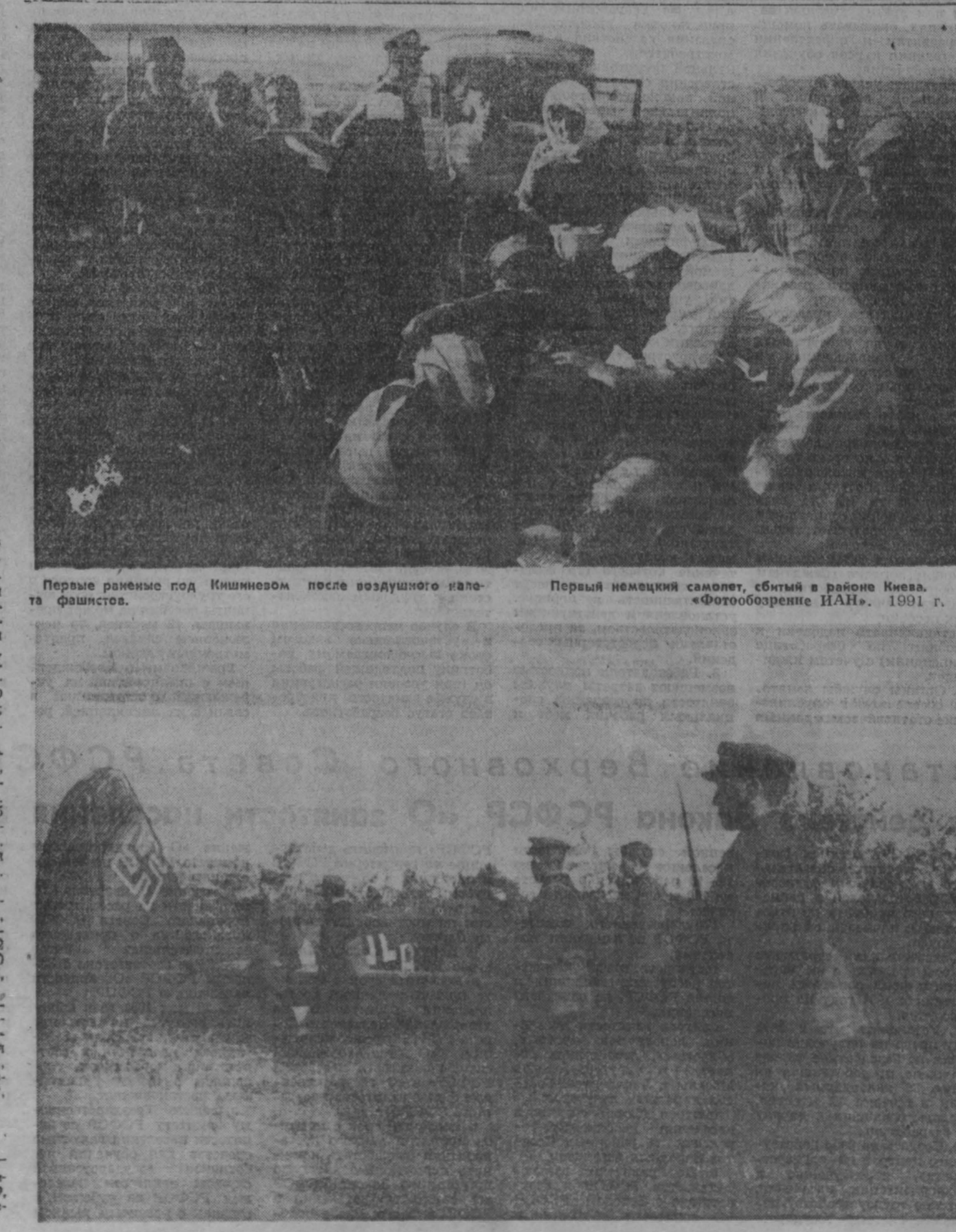
Первые раненые под Кишиневом после воздушного нападения фашистов. Первый немецкий самолет, сбитый в районе Киева. «Фотообзорение ИАН». 1991 г.