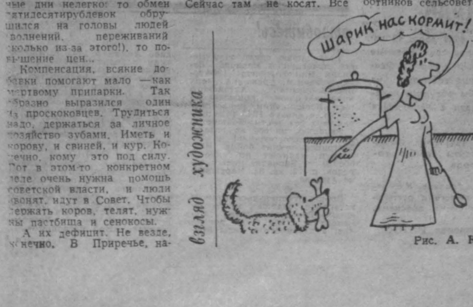
Рис. А. Клемина.

Председатель Верховного Совета СССР А. ЛУКЬЯНОВ. Москва, Кремль, 20 мая 1991 г.