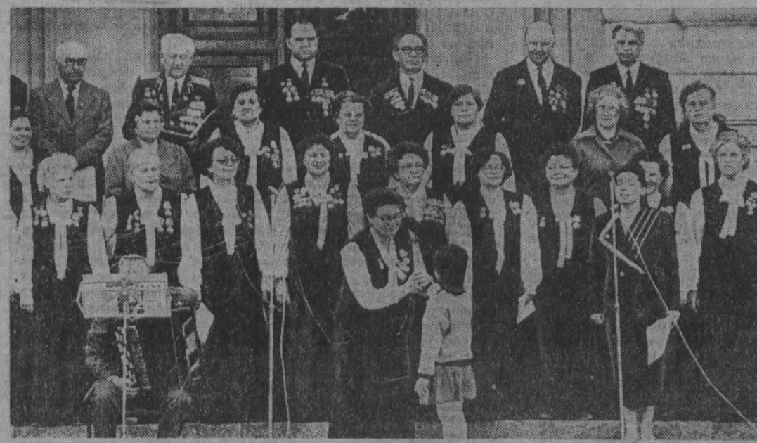
Эти два коллектива — хореографический ансамбль «Кузбасс» и хор ветеранов объединения «Кузбассэлектромотор» — хорошо знают в областном центре. Они постоенные участники праздничных мероприятий, смотров-конкурсов. Кемеровчане всегда тепло принимают выступления самодельных артистов.