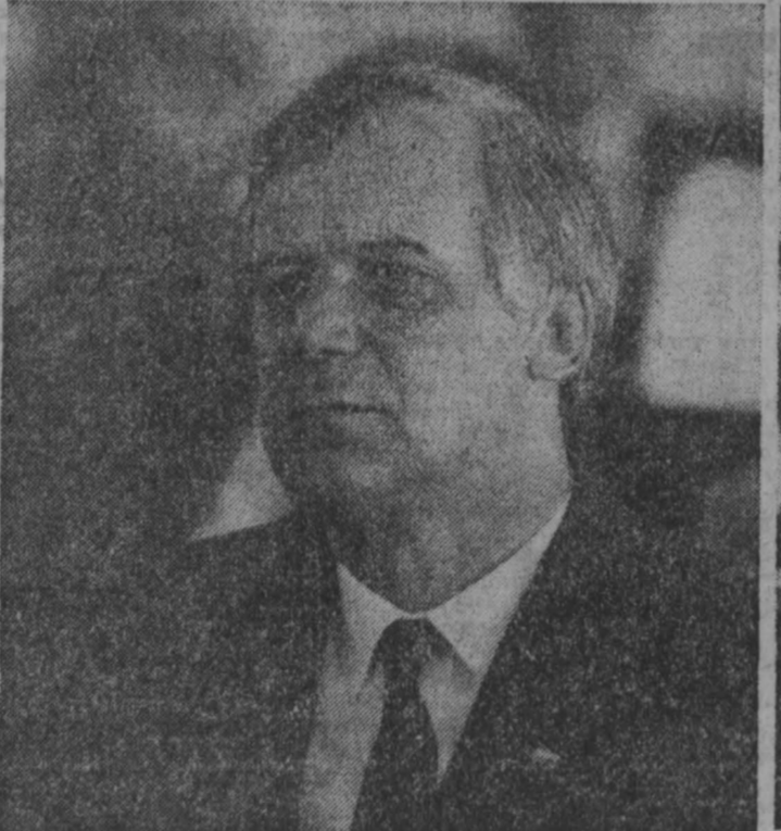
РЬКОВ Николай Иванович