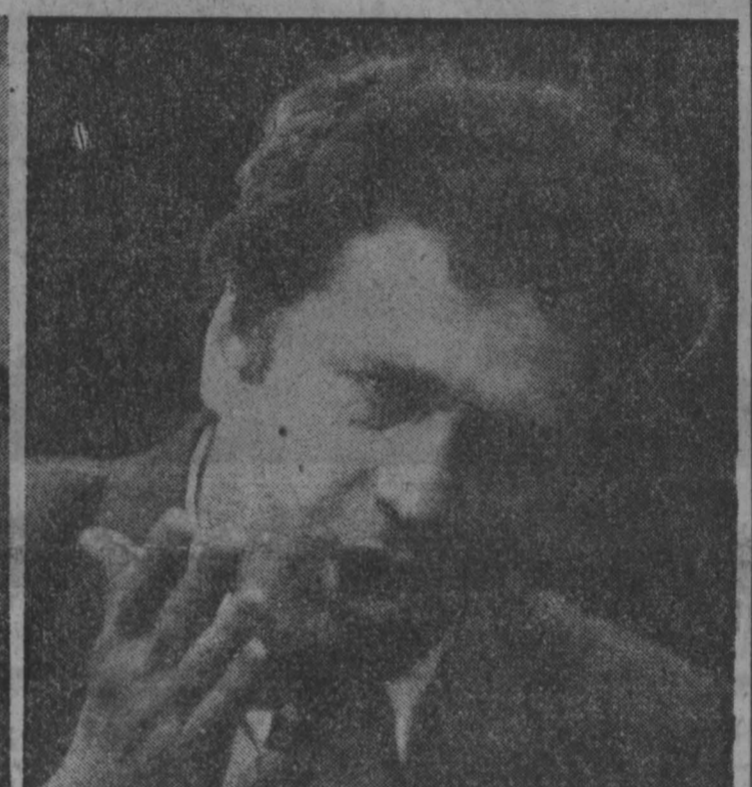
ЖИРИНОВСКИЙ Владимир Вольфович