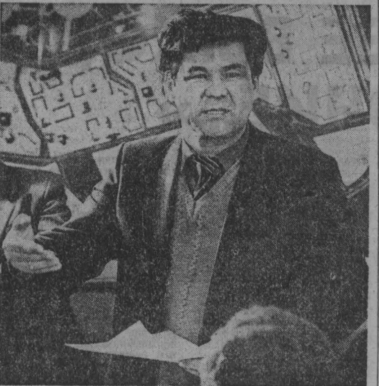
ТУЛЕЕВ Аман Гумирович