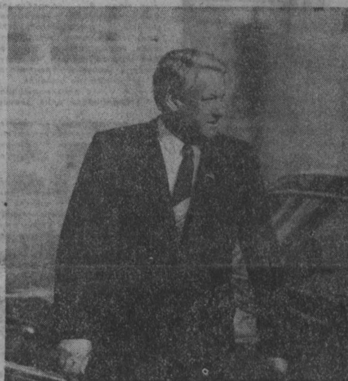
ЕЛЬЦИН Борис Николаевич