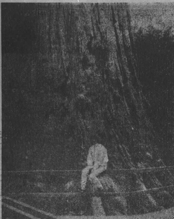
Калифорнийская и жителям других регионов США, а также многочисленным туристам хорошо известен парк под названием «Древний чудес». Здесь действительно собраны зачастую уникальные породы деревьев, например, красного дерева или секвойи, которые живут до 1000 лет... Родина этих хвойных пород — юг Орегона и север Калифорнии. Красными их называют иногда из-за яркого цвета древесины. Вы видите посетителями парка у подножия секвойи. Высота этого гиганта — 123 м, диаметр ствола — 5 метров.