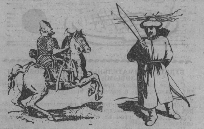
Иллюстрации из фондов областного краеведческого музея: «Прах тогузцев в ясаком в русский город» (гравюра XVII века); вооружение русского воина, калмык (из книги С. Герберштейна).

И страх сей обратился в народе в смех, что 40 человек беглецов наделали столько тревоги и навели страху.