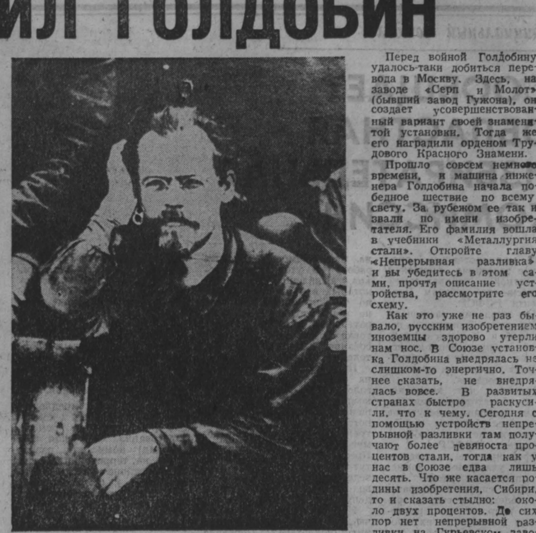
За 175-летнюю историю Гурьевского металлургического в его цехах не раз вершилась судьба отечественной металлургии. Не считайте это за местный красный патриотизм: небольшие разливочные заводы как нельзя лучше подходили для опыта, давшего новаторства. Приведу только один пример. В начале 1922 года журнал «Сибирский горно-рабочий» писал: «Маленькая домна старейшего Гурьевского завода... умаяет и возродит уральской промышленности».

Сказано это по случаю выплавки в Гурьевске чугуна не на древесном, как это велось исторически, а на каменном угле Кузбасса.