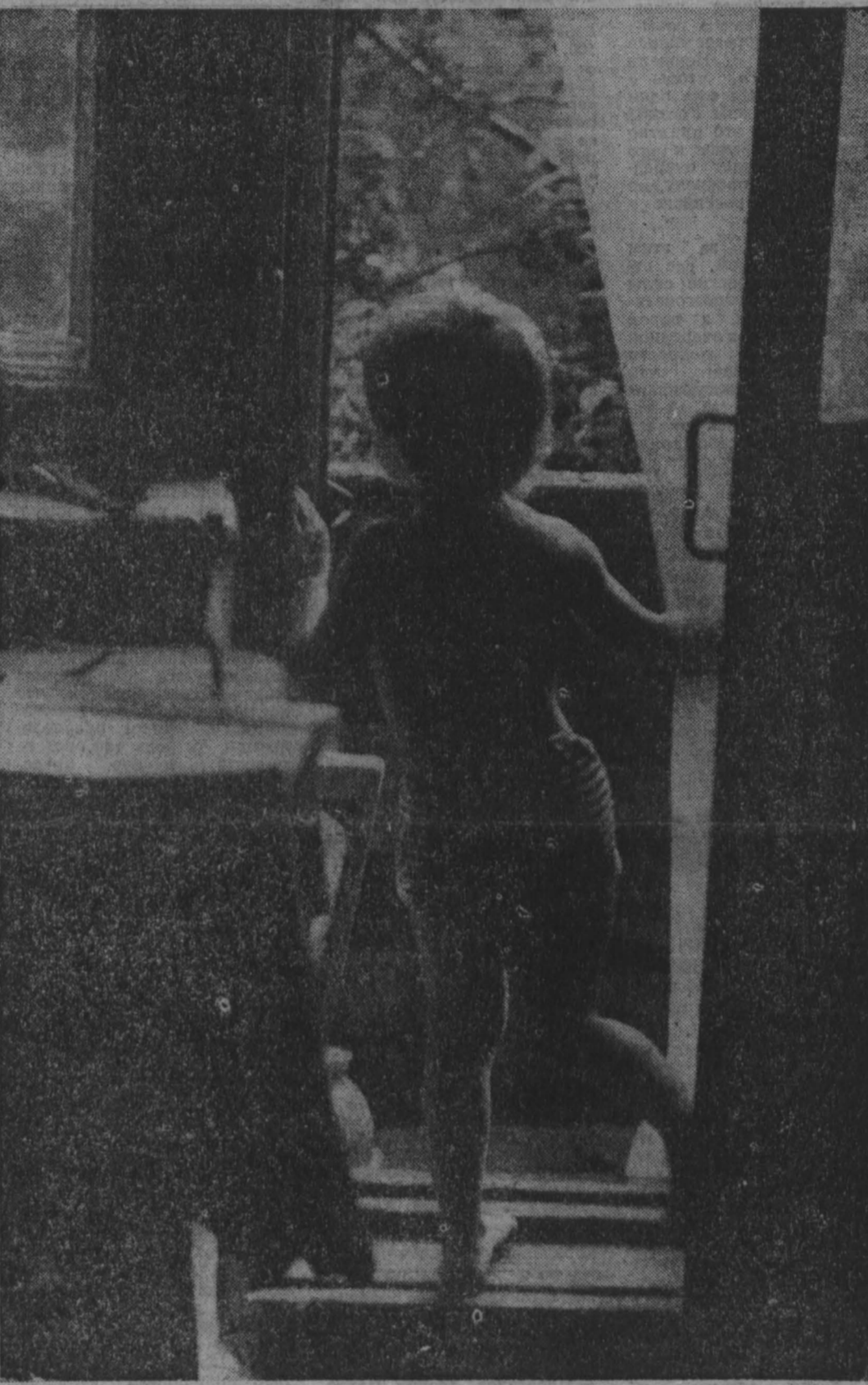
фотоконкурс «Мы и мир» ЛЕТО НАСТУПИЛО.

сегодня — Международный день защиты детей