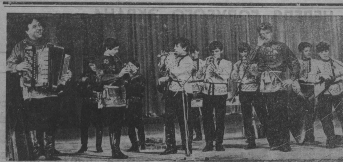
третий Всесоюзный фестиваль народного творчества