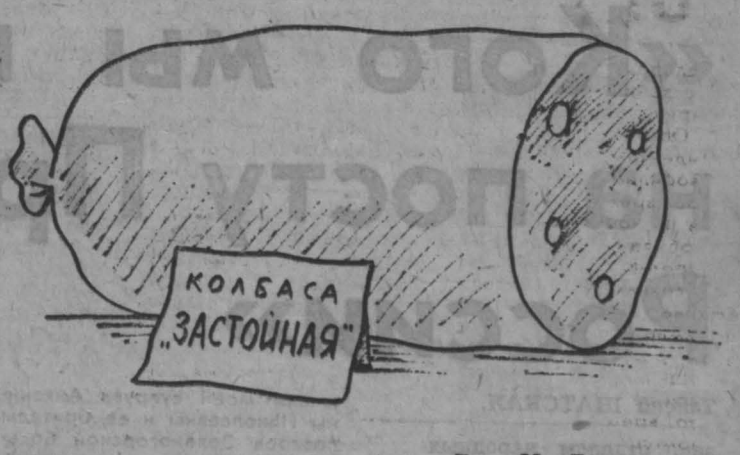
Рис. М. Ларичева.

Отстаивать от жизни, отстаивать. Теперь применяется. Да еще как лихо! Постановлением Совмина РСФСР № 163 от 20.03.1991 г. с 16 апреля с табачных изделий отечественного производства (папиросы первого класса, сигареты первого и второго классов) взимается акцизный сбор в размере 50 процентов от новой цены, пятипроцентным налогом не облагаются. Акциз распространяется и на настольные, пилеры, но уже в размере 25 процентов. Возможно, государство