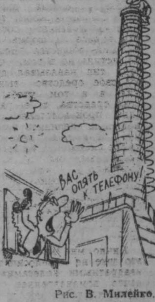
Рис. В. Митейко.

городских программ, направленных на улучшение условий обучения и воспитания детей и подростков, создание условий их социальной защищенности в период перехода к рыночной экономике. Счет городского фонда народного образования: 000142910, городское отделение Жилсообщаки, МФО 800341, городскому отделу народного образования. Справки по всем интересующим вопросам можно получить в городском отделе народного образования по телефонам: 23-35-07 и 25-54-65. Комиссия по образованию, науке, культуре и духовному возрождению Кемеровского городского Совета народных депутатов. Кемеровский городской отдел народного образования.