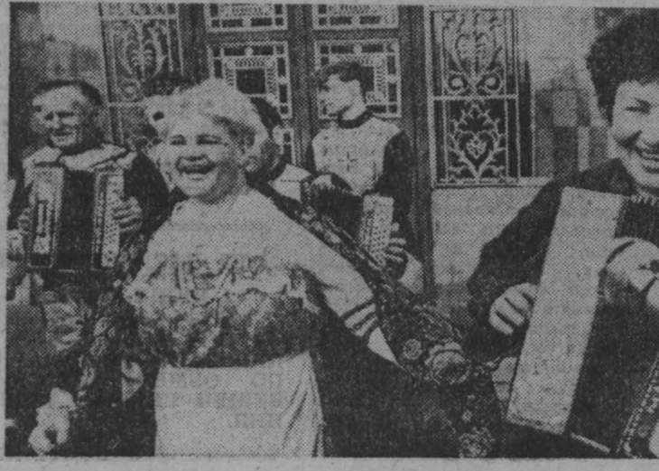
КУЗБАСС 29 мая 1991