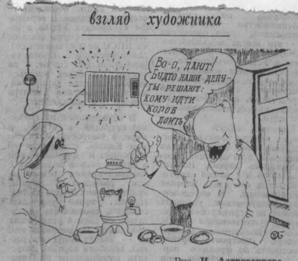
Рис. Н. Астраханцева.

туацию, при которой кто-то из состава нынешнего исполкома останется в прежней должности? Заместителем председателя, секретарем, начальником управления или заведующим отделом? Наверное, не исключено. Это только в кино рабочий от-