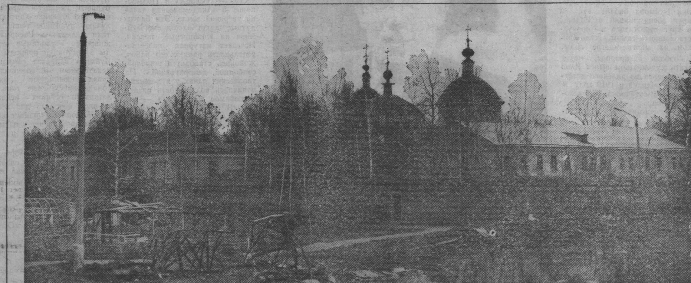
Дольше других сталинских застенков хранила свои тайны Сухановская тюрьма особого режима. Плотная завеса секретности скрывала ее существование даже от охранных органов. Подмосновский монастырь, носивший прежде название Ектерининской пустыни, был превращен в страшный филиал Лефортовской тюрьмы. В 1927 году, при наряде внутренних дел И. И. Ежова, который потом сам угодил в сухановские казематы. По свидетельству бывших сотрудников тюрьмы, она представляла собой следственный изолятор для «особо опасных государственных преступников». Одновременно в «Суханове» содержали до 150 человек. На ночные допросы сюда иногда приезжал со святой Берия, для него был оборудован специальный кабинет с прямым телефоном в Кремль. Редко кто из узников находил здесь больше двух недель — именно такой срок был установлен для «выбивания» показаний и признаний вину от подсудимых. Поговор за всю историю тюрьмы не было, отсюда сели всего два пути и месту расстрела. Избирательство того, что заключенных казнили прямо здесь, за мемориальными стенами, пона нет! или на смертную расстрельную каторгу. Участ узников была предельно заражена.