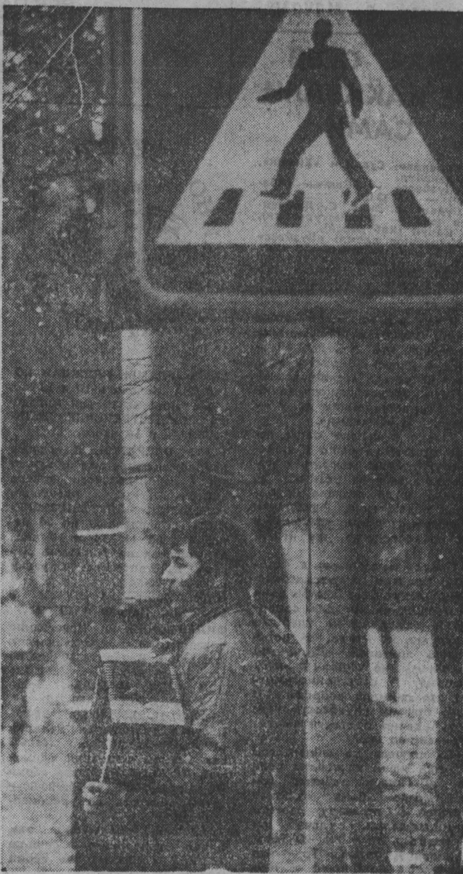
Чего только не увидишь на улицах Кемеровала.

КЕМЕРОВСКИЙ ГОРОДСКОЙ КОМИТЕТ СОЦИАЛЬНОЙ ЗАЩИТЫ УЧЕНИКА И УЧИТЕЛЯ.