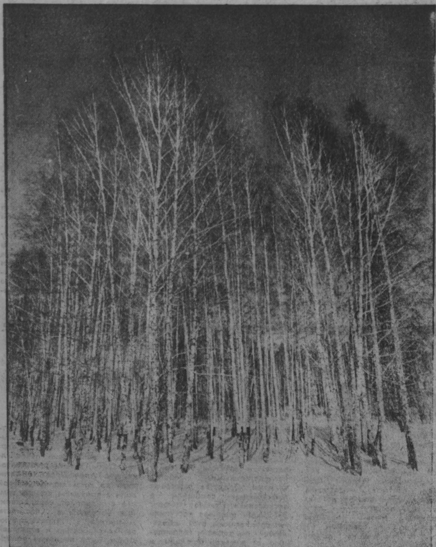
Пришла зима. по сводкам УВД