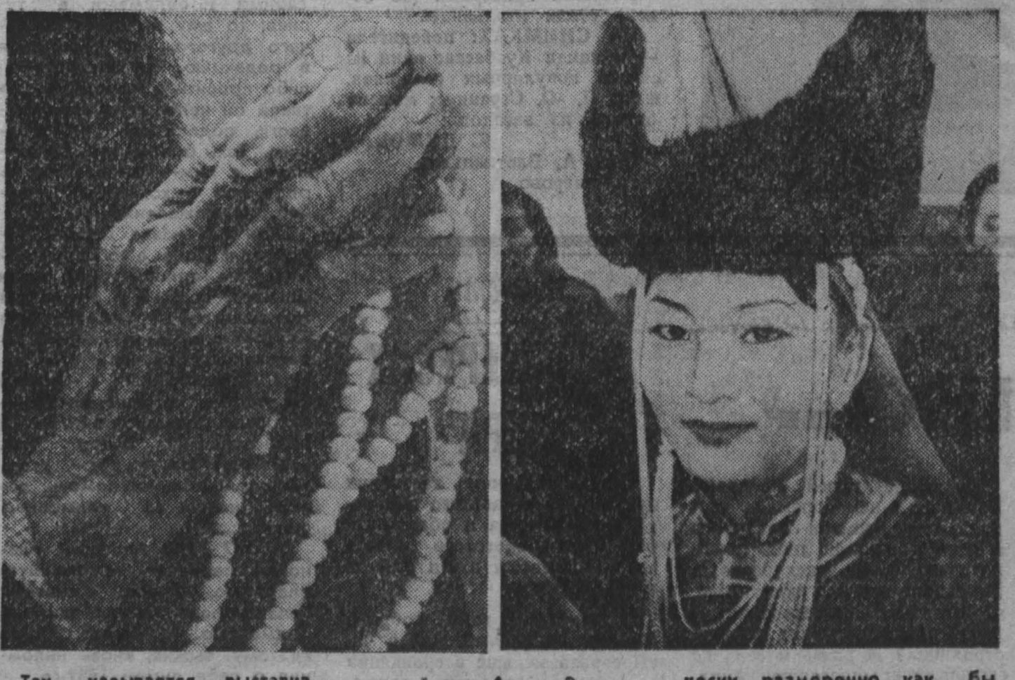
Так называется выставка фотографий, открывшаяся в информационно-культурном центре Монголии в Москве.

Сейчас уже ясно, что оказался прав. Скептики и маловеры посланы, а втори-