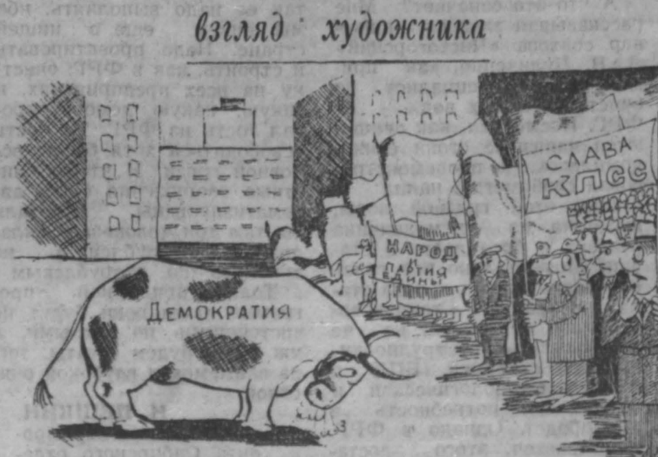
Рис. Н. Астраханцева.