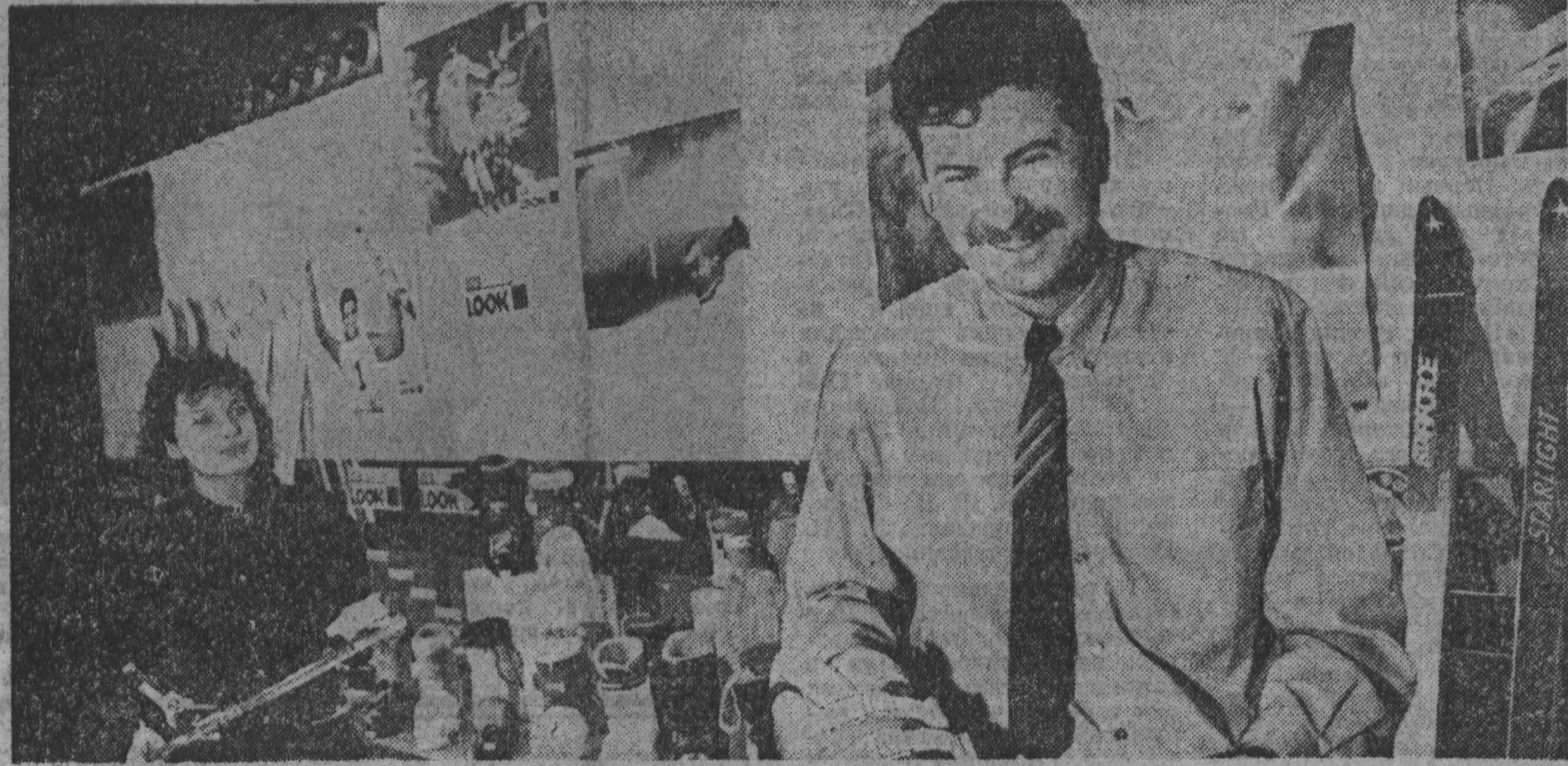
В эти дни молодежный центр кемеровского завода «Химмаш» привлекал к себе внимание деловых людей: здесь открылась международная выставка изделий для спорта и отдыха. Образцы своей продукции демонстрируют известные в мире австрийские и польские фирмы «Крайслер», «Фишер», «Доннай» и «Датшанин». Это горные и беговые лыжи, танкетные ракетки, спортивная обувь, одежда и сумки. Приобрести их — причем в кратчайшие сроки — может любое предприятие, организация или кооператив, имеющие свободную конвертируемую валюту или возможность заключить бартерную сделку. Фирмы продают свою продукцию в 2-3 раза дешевле, чем их европейские коллеги.