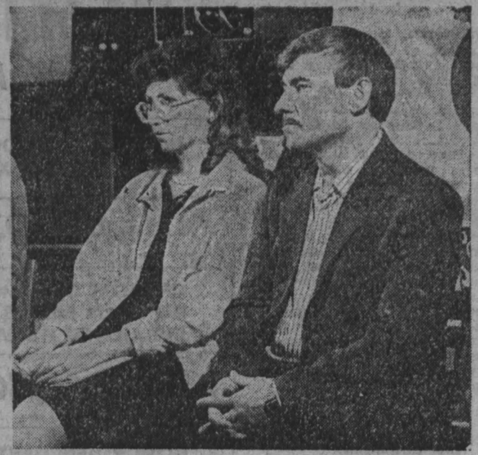
Спор был жарким.

Никто из присутствующих не предполагал, что разговор будет настолько откровенным и пойдет по такому руслу.