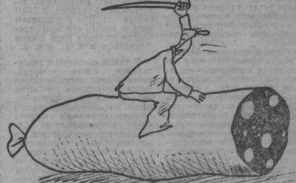
Рис. М. Ларичева.