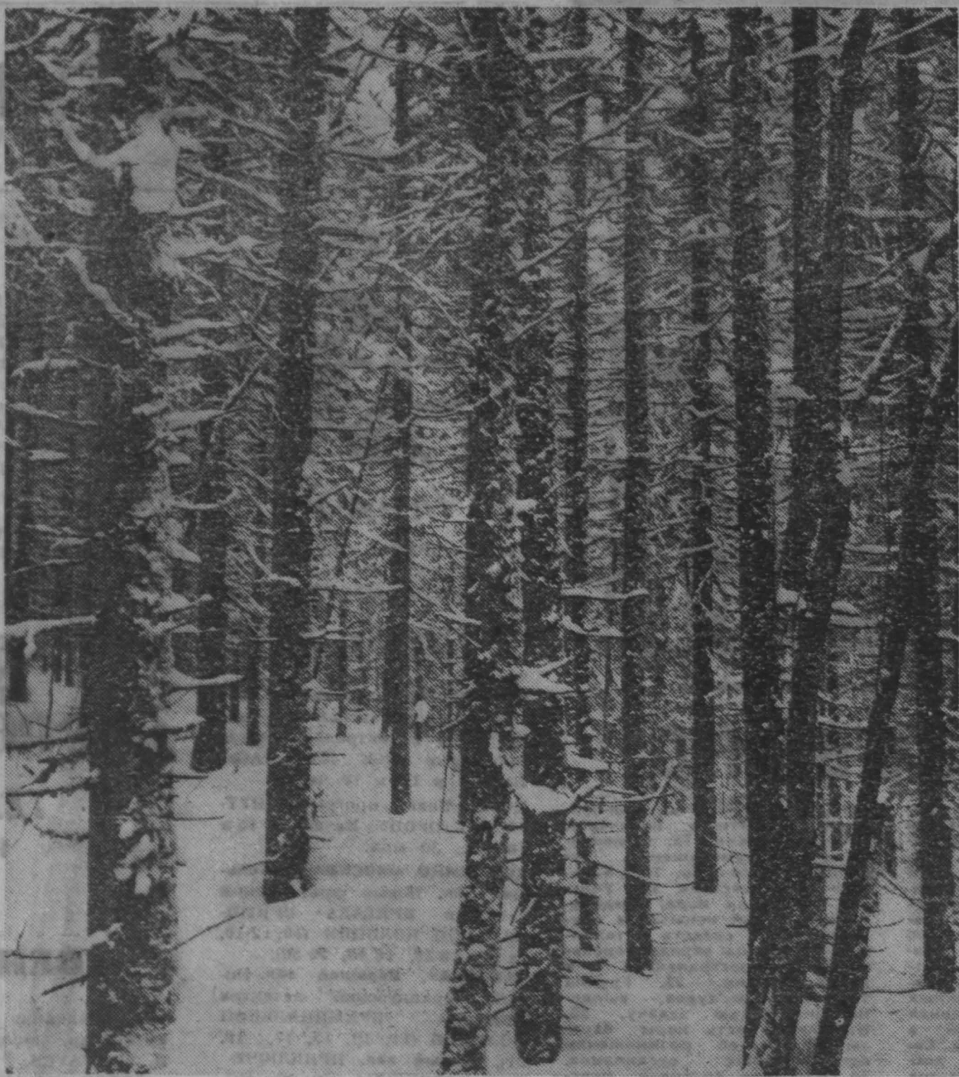
Зимний лес — как сказка!

В. ПЛИСЕНКО, собкор «Кузбасса», г. Ленинск-Кузнецкий.