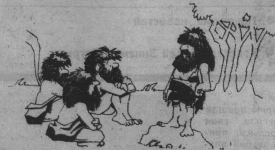
— И все-таки я настаиваю: прежде всего мы должны избрать постоянного председателя! (Из американской печати).