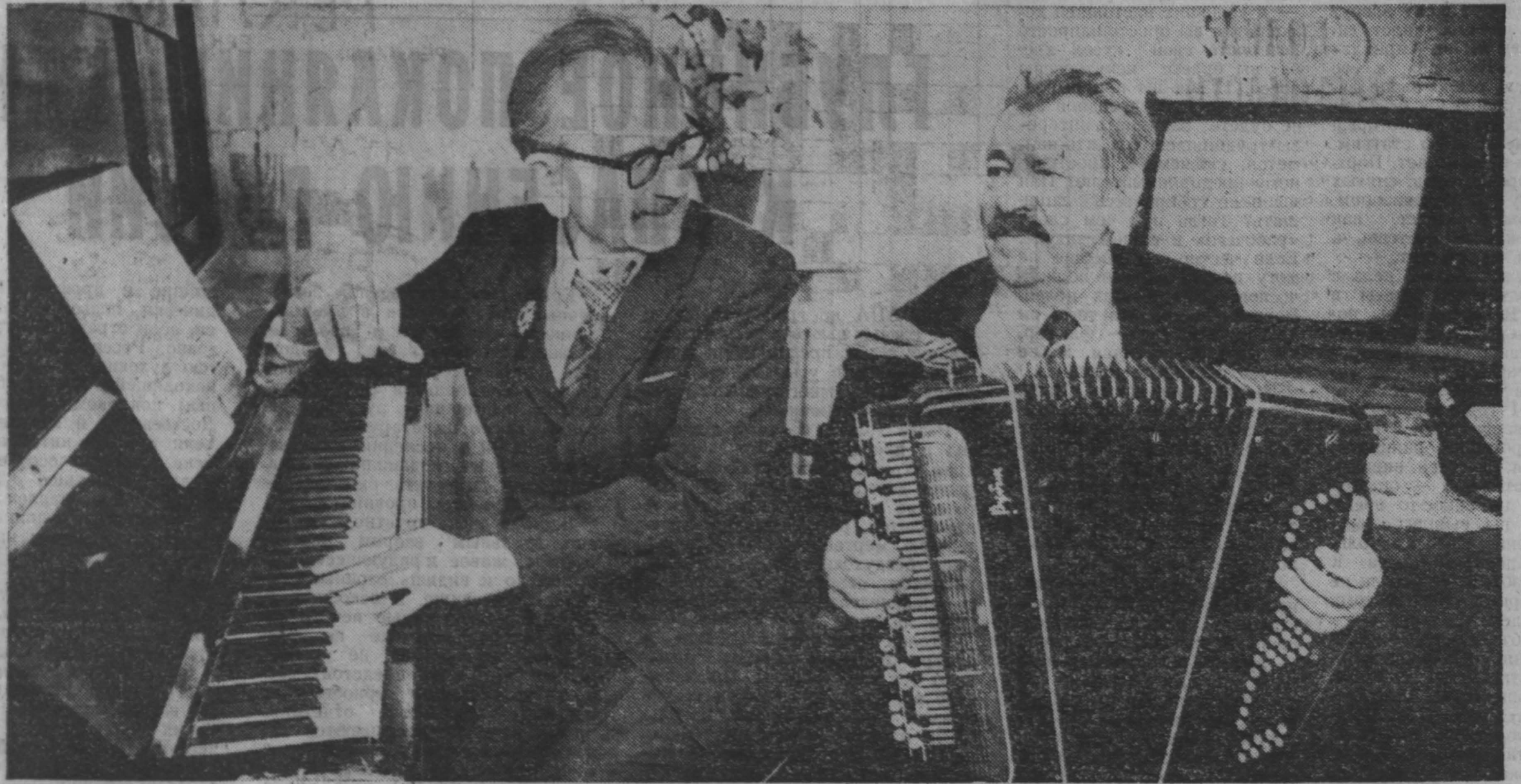
о людях хороших