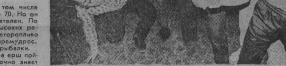
третий Всесоюзный фестиваль народного творчества