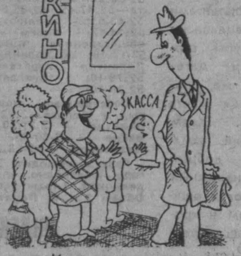
— Извините, а на каком вы будете сидеть месте? Рис. В. Милейко.