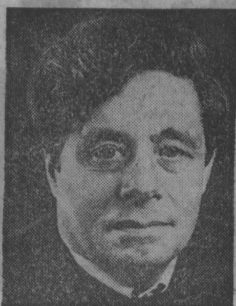
каким быть «Кузбассу»-91

Если бы этот случай был личным! Сейчас, когда в областных театрах главные режиссеры мнят себя с космической скоростью (даже «лишь гнать не успеваем» — слышны), невольно вспоминаются мастера режиссуры, которых буквально выгнали из Кузбасса. А ведь и из них признавали капитализм, всерьез, и