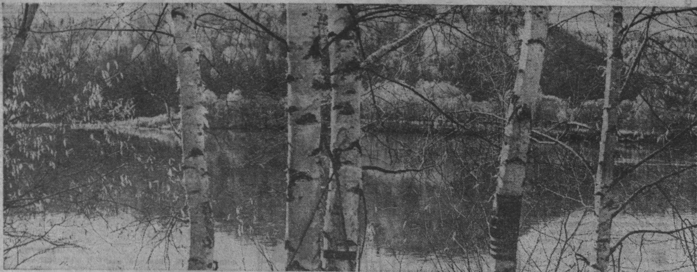
Осенняя пора — природы увядание.