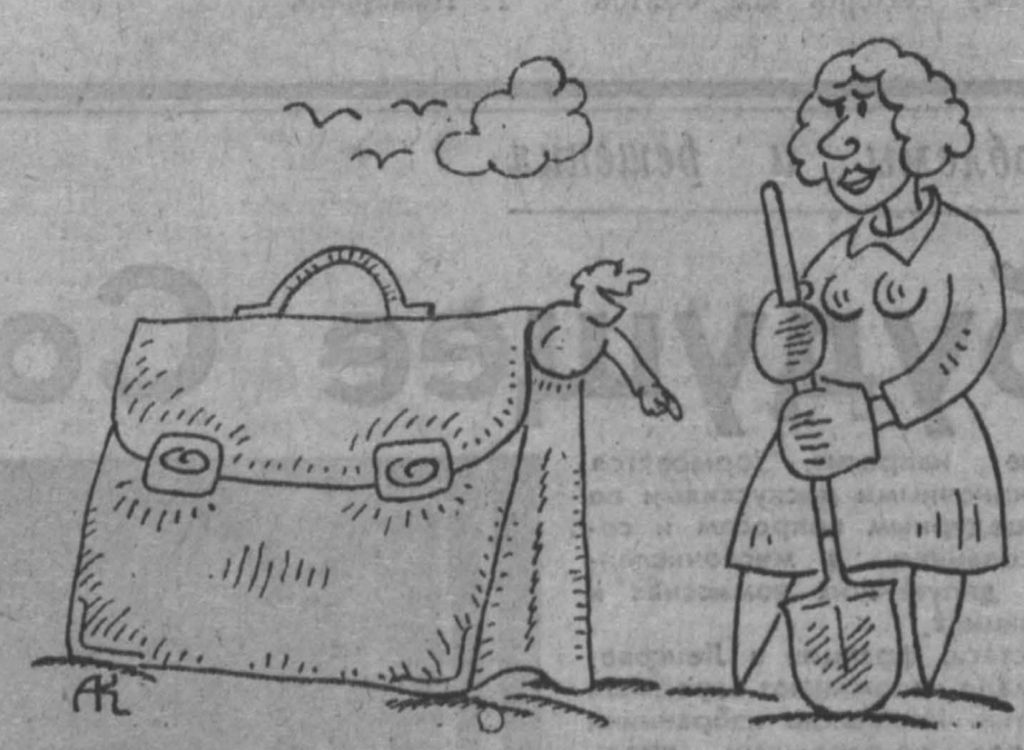
Рис. А. Климова.