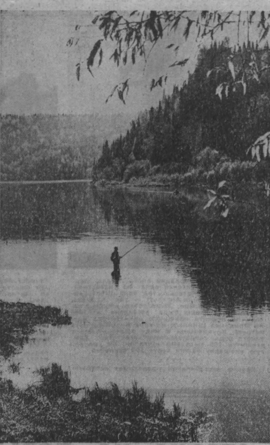
В ВЕРХОВЬЯХ ТОМИ