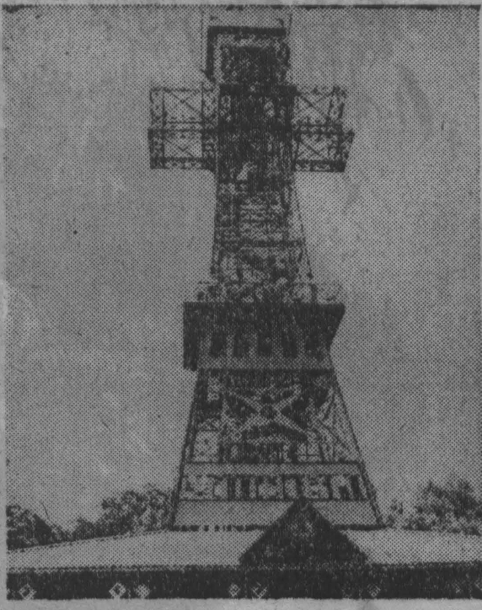
ФРГ. После реставрации вновь стала доступной для посетителей одна из известнейших достопримечательностей близ Штольберга (земля Саксония-Ангальт) — так называемый «Железный крест». 35-метровая ануралметаллическая Башня была возведена в 1896 году по проекту немецкого архитектора Карла Фридриха Шиннеля на горе Лурдберг (575 метров). Крупнейшая в мире железная крест такого рода свидетельствует агентству АДИ, держится 100 тысячами заклепок. На смотровую площадку башни ведут 200 ступеней.