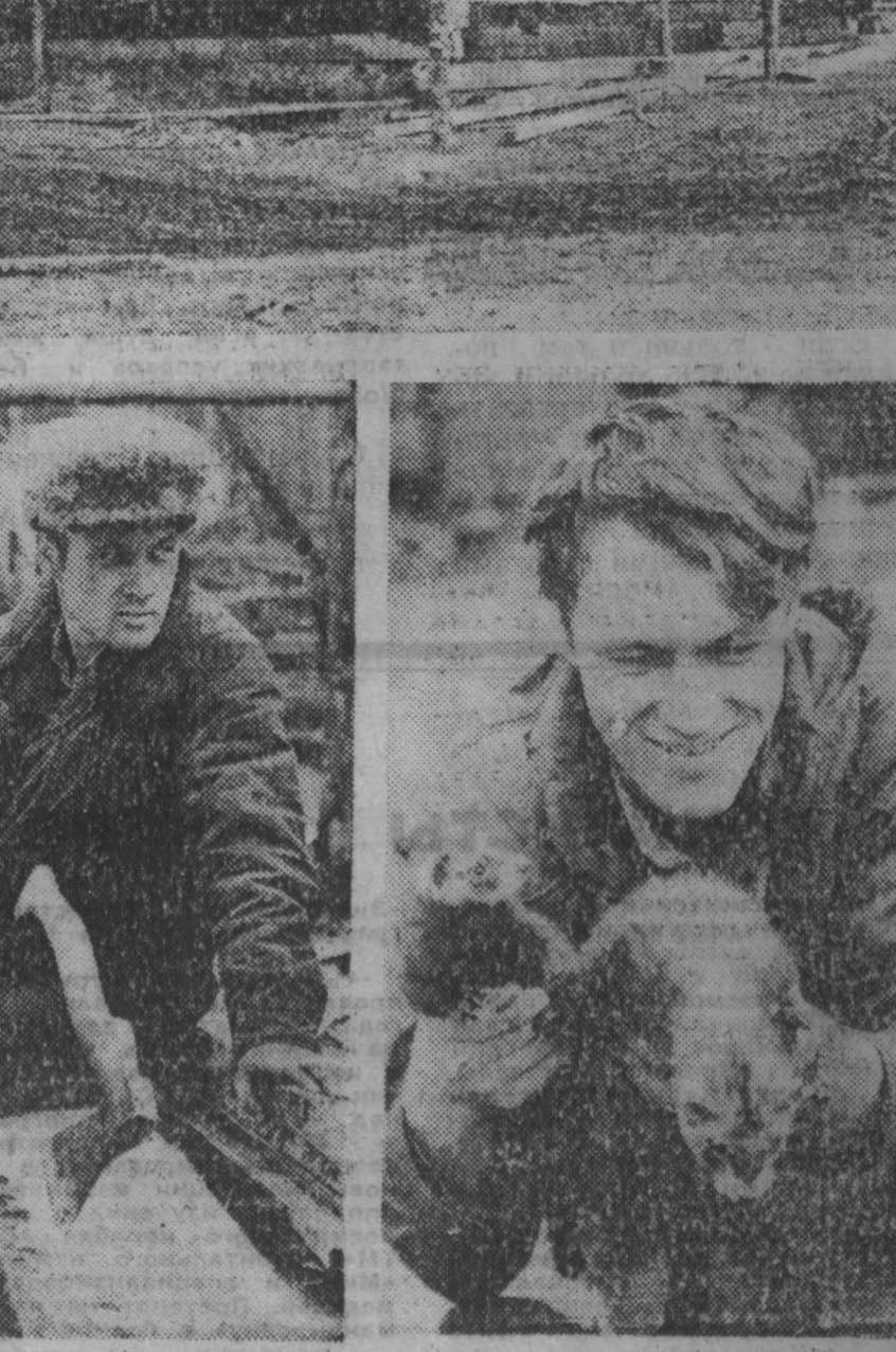
Топкинский — Юргинский районы.

НА СНИМКАХ: давно не видела Ясная Поляна новостройки; отец и сыновья Астаховы; вот таких ценных зверьков вознамерился вырывать Александр.