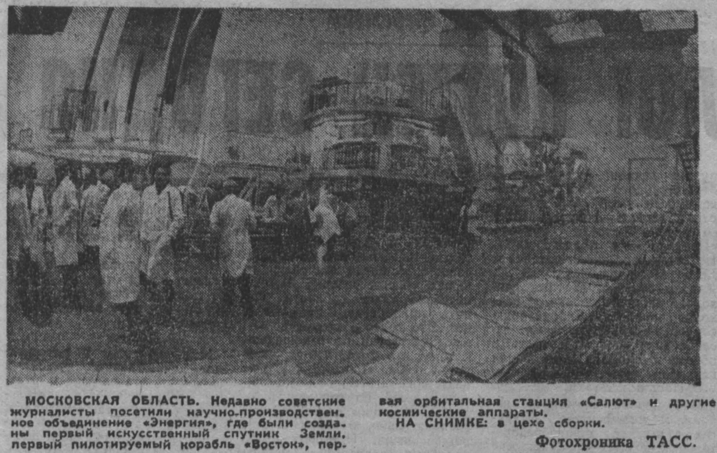
МОСКОВСКАЯ ОБЛАСТЬ. Недавно советские журналисты посетили научно-производственное объединение «Энергия», где были созданы первый искусственный спутник Земли, первый пилотируемый корабль «Восток», первая орбитальная станция «Салют» и другие космические аппараты. НА СНИМКЕ: в центре обложки.