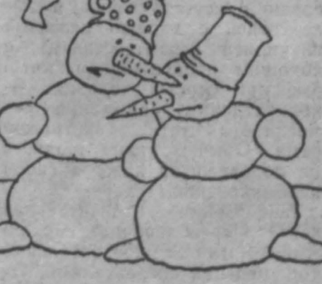
Рис. В. Эренбурга.

ВНИМАНИЮ РУКОВОДИТЕЛЕЙ ПРЕДПРИЯТИЙ И УЧРЕЖДЕНИЙ БЮРО УСЛУГ «КЕМЕРОВАННА» предлагает художественное оформление помещений школ и детских комбинатов по бонусному расчету. Обращаться по адресу: ул. 50 лет Октября, 14. Телефон: 23-14-66. Кузбассбирреклама.