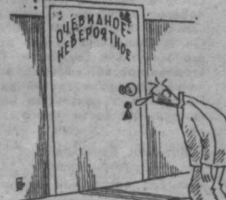
Рис. М. Ларцева.