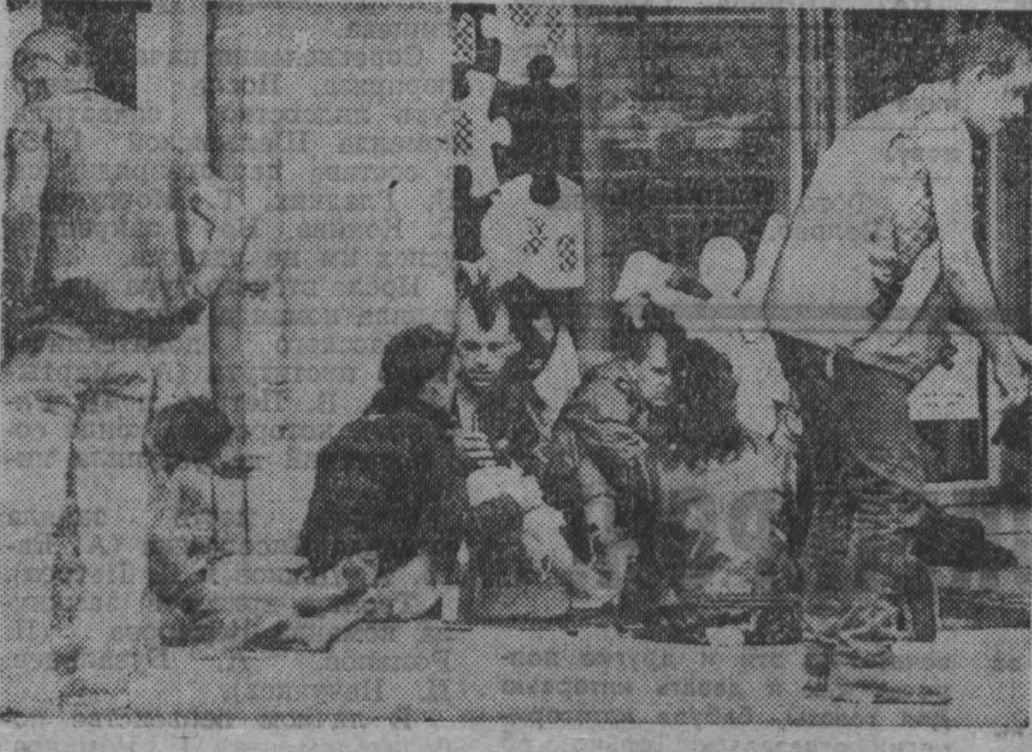
из путевых заметок