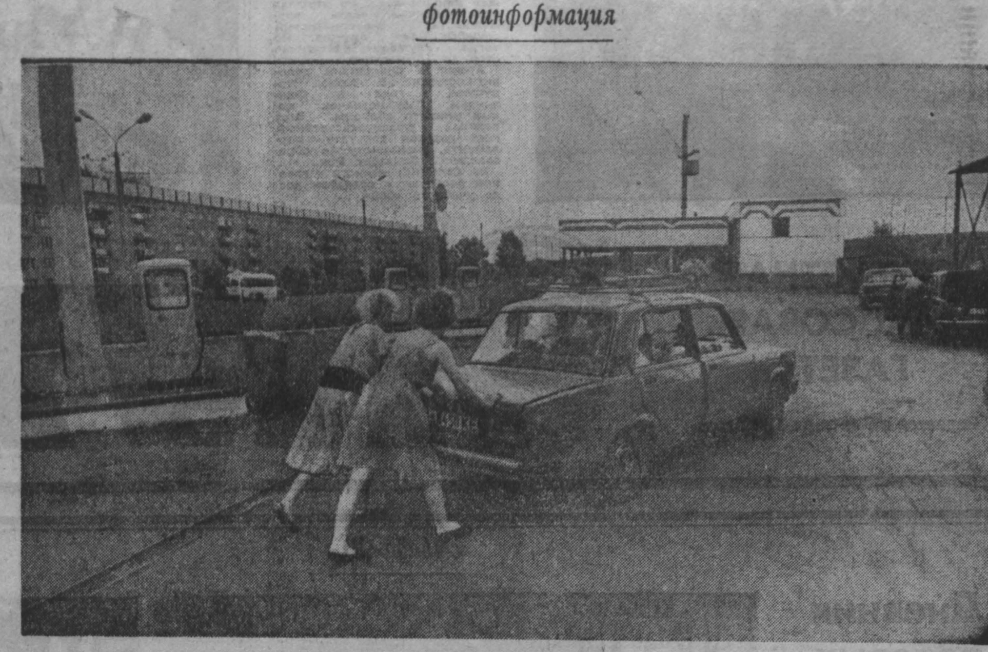
ТАК И ЖИВЕМ в нестабильном снабжении Кузбасса горюче-смазочными материалами! НА СНИМКЕ: печальный сюжет у АЭС на ул. Транспортной.