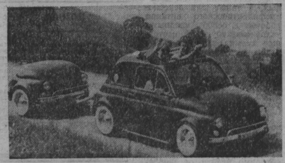
Автомобиль и маленькая теленка.