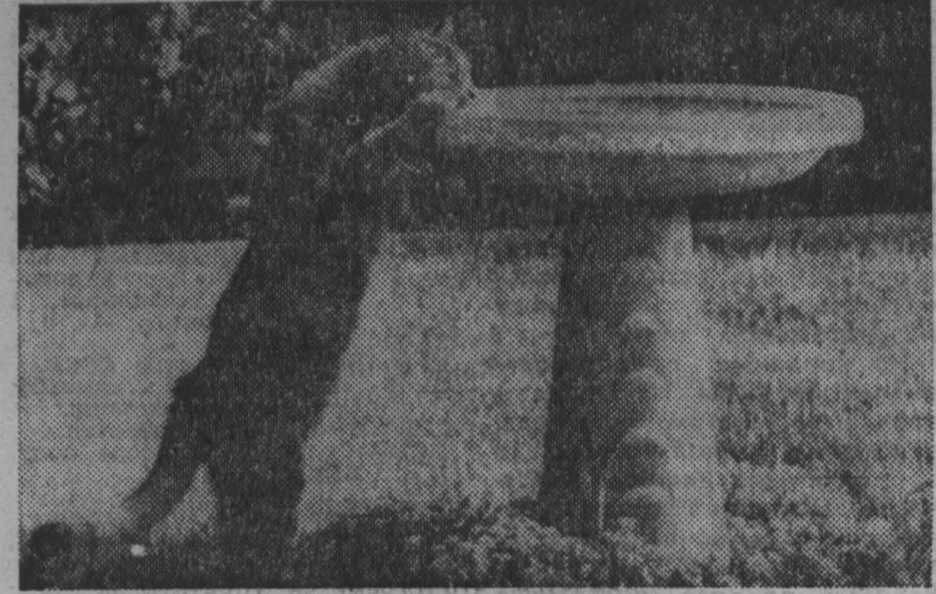
США. Жарал М так хочется освежиться...