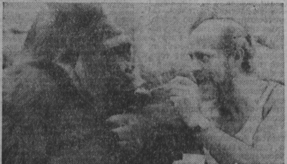
Горилле Диане из зоопарка в Бристолье (Великобритания) исполнилось 18 лет. Она отлич- ается тем, что всегда не- прочь поест... Вот и в день своего рождения Диана пред- почла на завтрак любимое ла- комство — простоквашу.