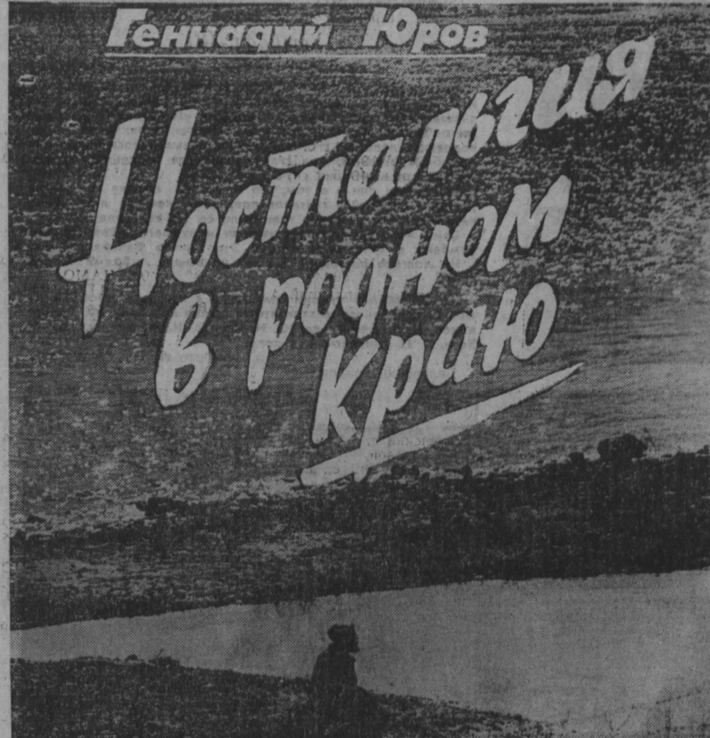
Генячий Юров Достигаясь в реку

Когда приезжаешь на стройку и видишь развороченную долину, могучий хребет гравия, легкий поперек течения и оставивший реке лишь узкий проем — это не просто вид, а картина, которую не забудешь никогда. Вспоминаешь ее, когда видишь в вертолетах ложе будущего водохранилища, где горят кусты, сжигаются вырубленная древесина, ибо вывозить ее слишком дорого и хлопотно, миллионы кубометров леса сжигаются, когда они еще в самом начале своего пути.