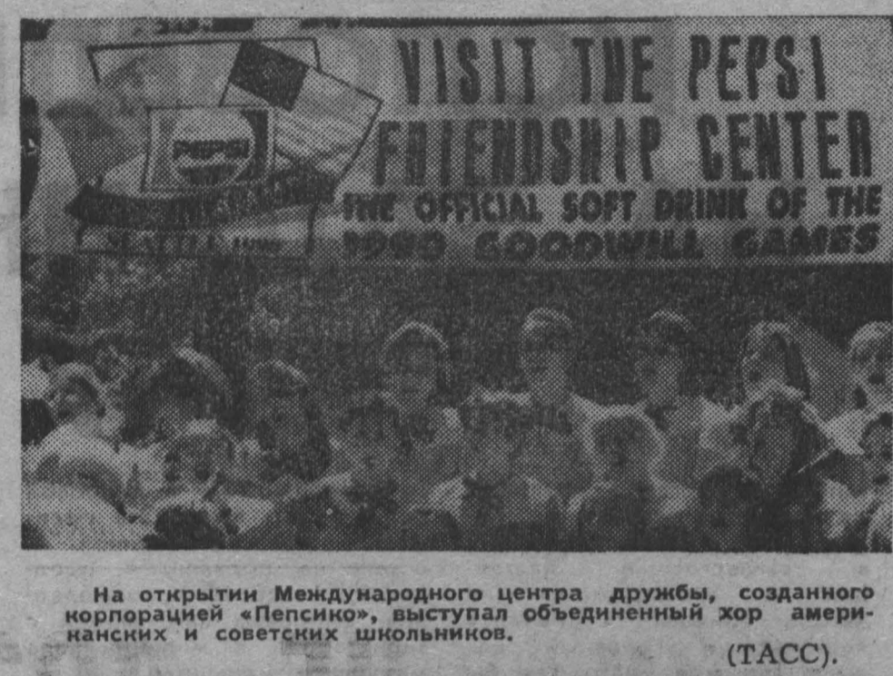
На открытии Международного центра дружбы, созданного корпорацией «Пепсико», выступил объединенный хор американских и советских школьников.