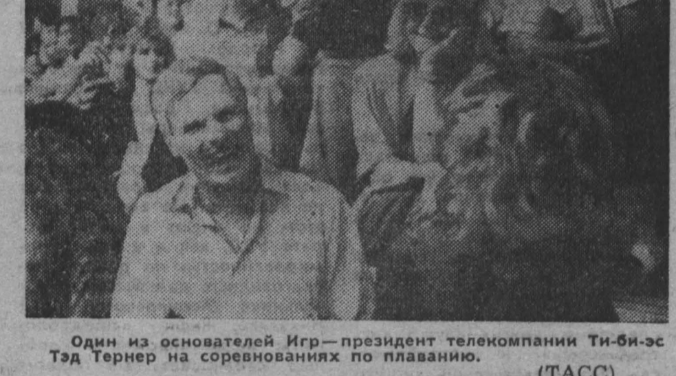
Один из основателей Игр-президент телекомпания Ти-би-эс Тэд Тернер на соревнованиях по плаванию.