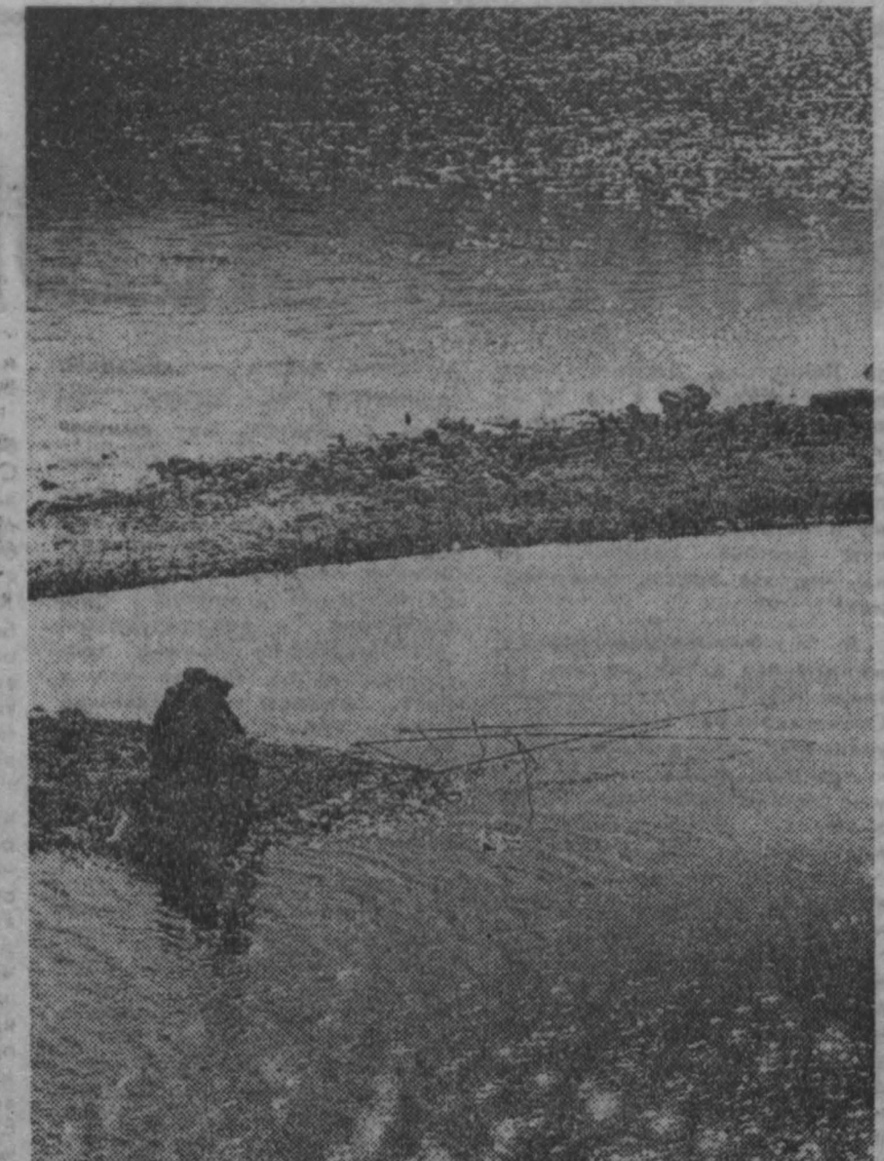
На утренней зорьке.