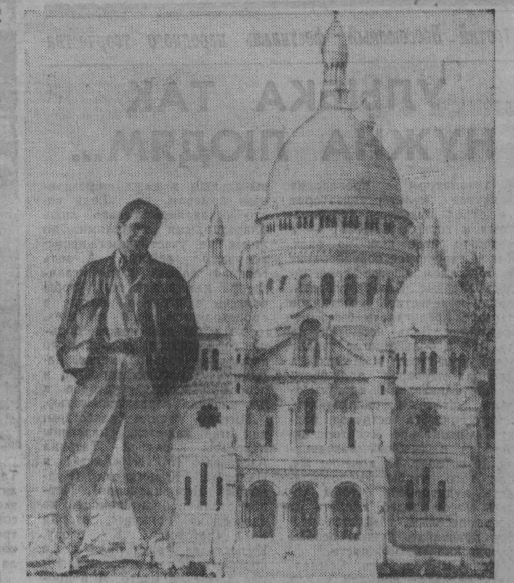
БЕЛЬГИЯ. Турнисту, впервые оказавшемуся в Хейсельском парке Брюсселя, предоставляется возможность за несколько часов осмотреть достопримечательности сразу... двенадцати стран — членов Европейского экономического сообщества.