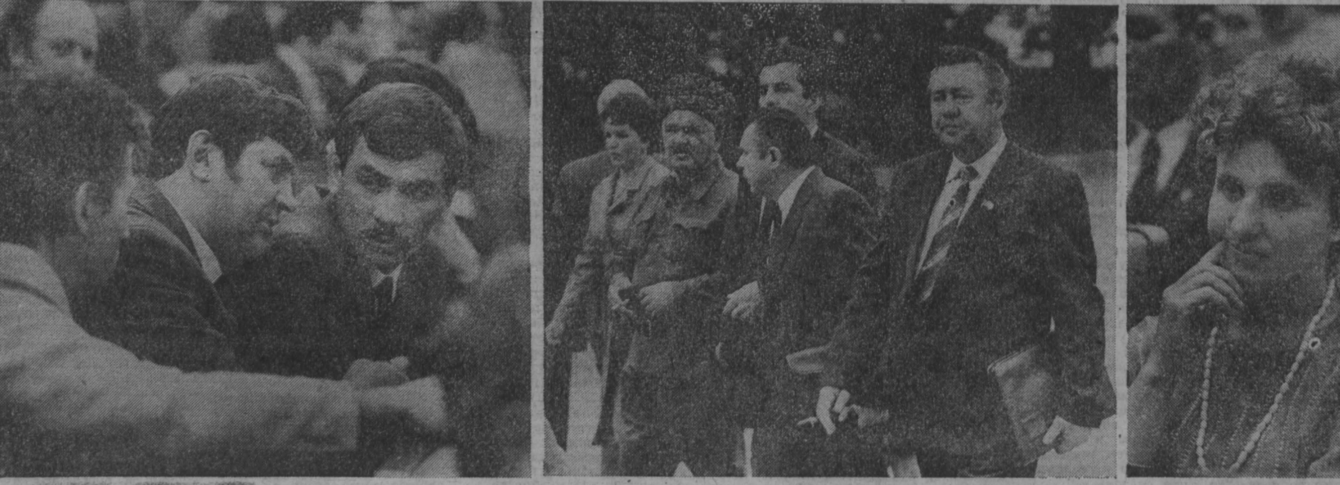
Во время работы съезда.