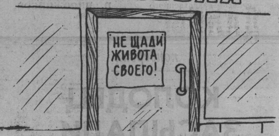
Рис. М. Ларичева.