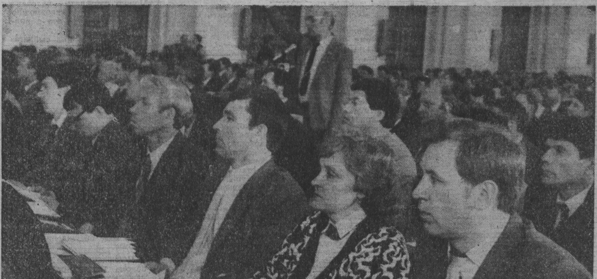
МОСКВА. Большой Кремлевский Дворец. Первый Съезд народных депутатов Российской Федерации. НА СНИМКЕ: депутаты из Кемеровской области в зале заседания.

В. КАРМАНОВ, соб. корр. «Кубзбасс», Маринский район.