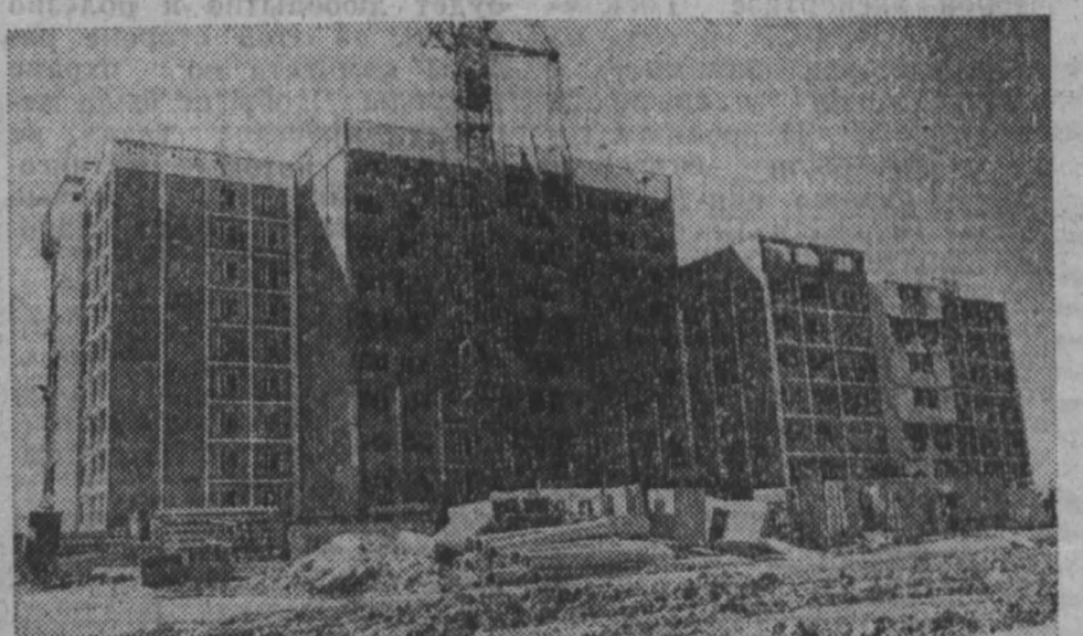
фоторепортаж с пристрасием

В соответствии со ст. 21 (п. 1) и ст. 52 Закона РСФСР «О выборах народных депутатов местных Советов народных депутатов РСФСР» из-за допущенных в ходе выборов и при подсчете голосов нарушений настоящего Закона областная избирательная комиссия