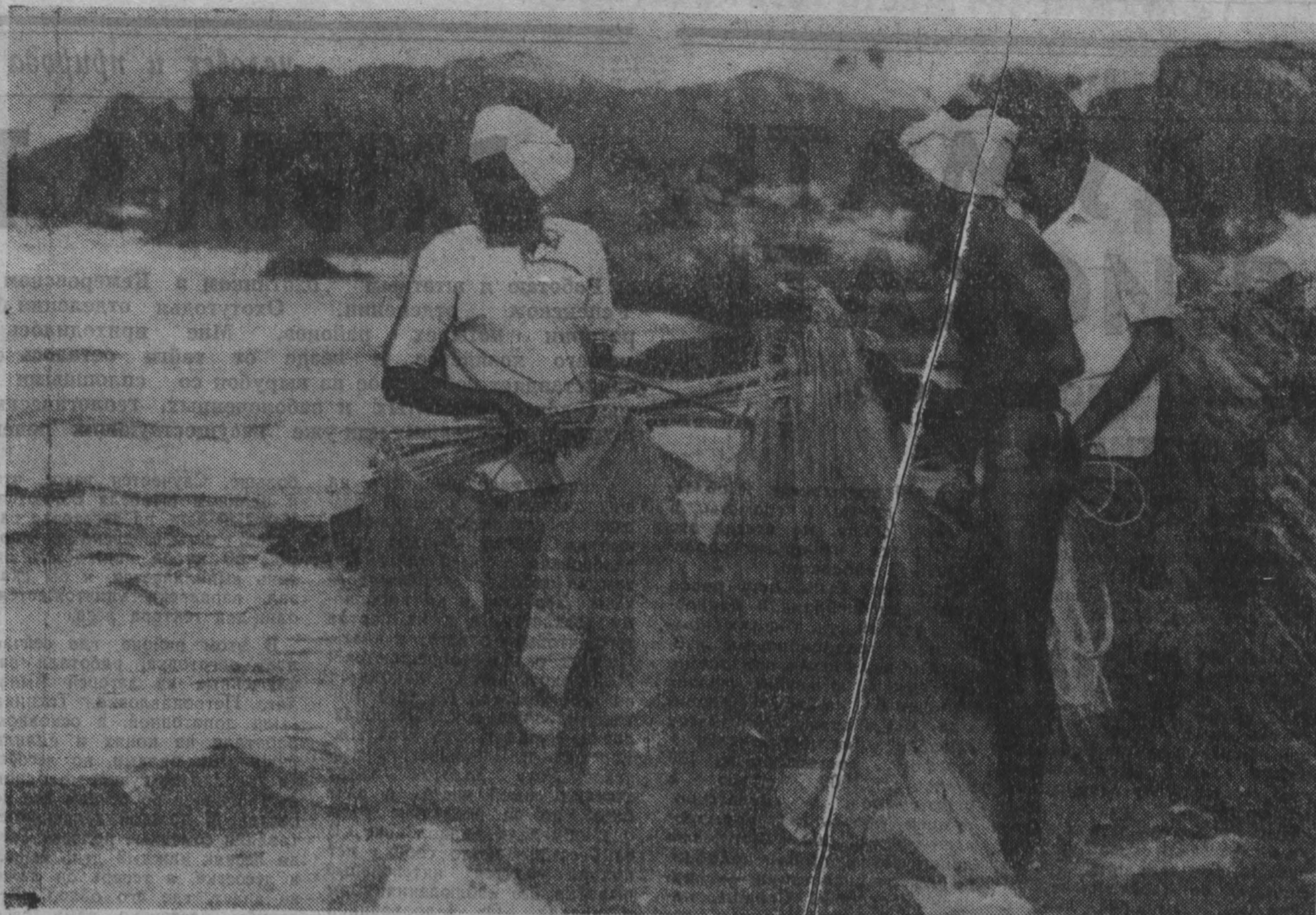
ИНДИЯ. Для жителей прибрежных районов штата Андхра-Прадеш морю — это и источник средств к существованию, и святня, которой они поклоняются.

личества обязательств друг друга. Срок погашения. Сроки погашения устанавливаются Министерством финансов СССР. По государственному казначейскому обязательству Сберегательного банка СССР выданным в тираж погашения, оплачиваются их нарицательная стоимость и купоны, включая купон того года, в котором это обязательство подлежит выкупу. Купоны, подлежащие оплате, не подлежат. В случае, если Владелец обязательства, которое вышло в тираж погашения, не предъявляет его к оплате, он имеет право на дальнейшее получение дохода по купону до окончания срока действия обязательства. 7. Государственные казначейские обязательства СССР, не вышедшие в тираж погашения, выкупаются учреждениями Сберегательного банка СССР начиная с 1 января 2006 г. 8. Государственные казначейские обязательства СССР вместе с купонами могут быть предъявлены для выкупа и получения по ним дохода до 1 января 2006 г. По истечении этого срока обязательства утрачивают силу и оплату не подлежат. 9. Государственные казначейские обязательства СССР и доход по ним освобождаются от обложения государственными налогами.