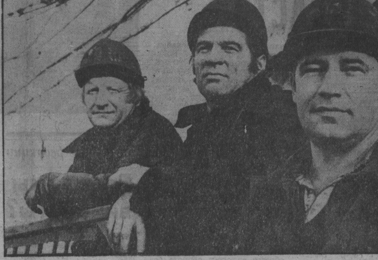
первая декада января