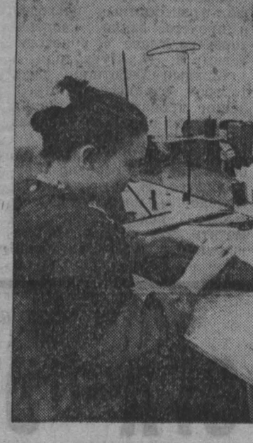
Мы уже рассказывали о том, что Новокузнецкая фабрика № 4 по ремонту и пошиву одежды открыла именное кафе и первые посетители. Растет популярность в городе нового предприятия службы быта. Молодежный коллектив именного ателье подготавливает молодежно-весенне-летний ассортимент одежды. Представительница молодежной группы для выпускного бала. Приняты по новым образцам и костюмы. Платяная фабрика в комплекте с сопутствующими изделиями, это модные блузки, рубашки, платья, юбки, сорочки, платья, всевозможные шарфики и носочки, выполненные руками самих мастериц ателье.